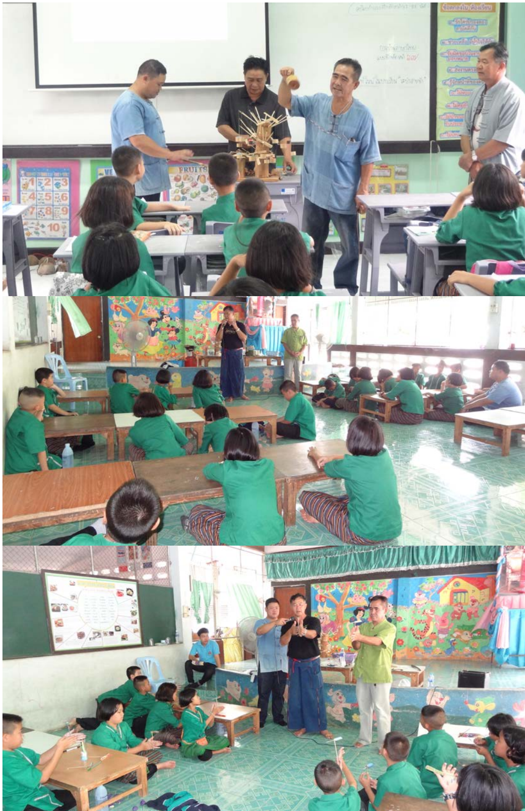
บรรยากาศการจัดโครงการฝึกอบรม ณ. โรงเรียนบ้านท่าหลุกสันทราย