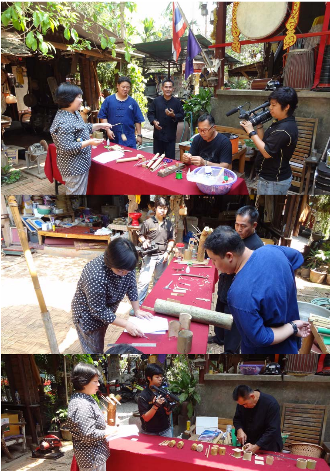
ผู้วิจัยเก็บรวบรวมองค์ความรู้เกี่ยวกับของเล่นพื้นบ้านล้านนา