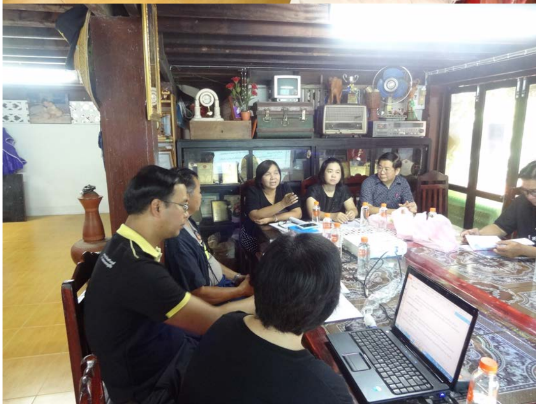
เวทีแลกเปลี่ยนเรียนรู้ ณ ศูนย์การเรียนรู้ศิลปวัฒนธรรมพื้นบ้านล้านนา “สลีปิงจัยแก้วกว้าง”