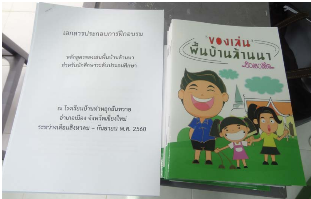
เอกสารประกอบการฝึกอบรม