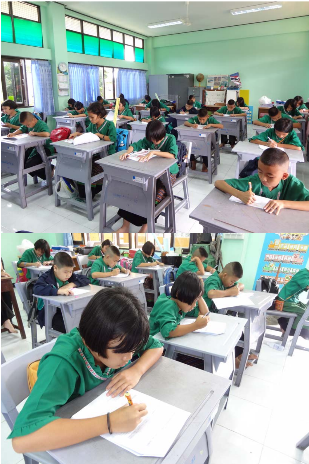
ผู้เข้าอบรมประเมินผลการใช้หลักสูตรฝึกอบรม