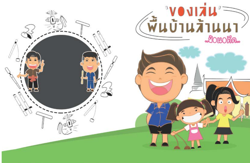
ปกหนังสือการ์ตูน เรื่อง ของเล่นพื้นบ้านล้านนา..ย้อนอดีต..