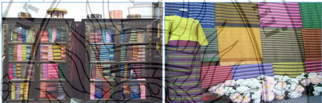
ภาพที่ 2.2 ผ้าไหมสันกำแพง

ขายด้วย สาเหตุที่เลือกเอานางงามมาขายเพราะเอาผ้าไหมมาเทียบกับตัวแล้วดูสวย นอกจากนี้ก็ยังส่ง เข้าประกวดตามงานฤดูหนาวด้วย พอเสร็จจากการประกวดก็นำนางงามมาขายของที่ร้าน ดังนั้นสัน กำแพงจึงถือว่าเป็นแหล่งนางงามและนางงามมีส่วนทำให้ผ้าไหมสันกำแพงขายดี ต่อมาลูกค้าเริ่ม หายไป เพราะต่างจังหวัดหรือแถบอีสานเริ่มมีการทอผ้าไหมเพิ่มมากขึ้น และมีการเปลี่ยนแปลงไปใช้ ไหมญี่ปุ่นที่มีความหนา และความสวย แต่ของสันกำแพงเป็นผ้าชิ้นใหม่ และคนมาเที่ยวก็ลดลงมาก พอไม่มีคนมาซื้อ ร้านค้าส่วนใหญ่ก็เปลี่ยนมาเป็นทอผ้าฝ้าย ทอผ้าขาวม้า และทอผ้าแบบอื่นแทนผ้า ไหม จึงทำให้ผ้าไหมสันกำแพงเริ่มหายไป (ผดุงเกียรติ ใหญ่ยิ่ง, 2559)