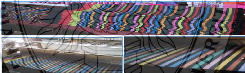
ภาพที่ 2.1 ผ้า ลาย 7 วัน ของสันกำแพง

ฝืน ไม่มีดอกดวงหรือลวดลายอื่น นอกจากนั้นผ้าชิ้นทางกระรอกคือแบบปั่นโก หรือ ซิ่นโก หมายถึงเอาเส้นไหมสีต่าง ๆ มาเป็นสี ๆ ให้เข้ากันแล้วทอ ลายของผ้าชิ้นเวลานั้นเป็นลายขวางเป็นส่วนใหญ่ จุดเด่นของผ้าไหมสันกำแพงคือ ลวดลายเฉพาะของสันกำแพง ซึ่งต่อมาได้มีการพัฒนามาเป็น “ลาย 7 วัน” คือการใส่สี 7 สีตามวันใน 1 สัปดาห์ หรือเรียกว่า เชิง 7 วัน จากนั้นก็มี ลายวงเดือน ลายน้ำไหล ซึ่งมีเฉพาะที่สันกำแพงเท่านั้น ในปี พ.ศ.2479 ผ้าไหมสีฟ้าได้รับความนิยมเป็นอย่างมาก เนื่องจาก พระวรวงศ์เธอ พระองค์เจ้าพิรพงศ์ภาณุเดช ทรงขับรถแข่งคู่พระทัย ชื่อว่าโรมิวลัส (Romulus) ซึ่งมีสีฟ้าสด ต่อมาเรียกกันว่าสีฟ้าพระ สีฟ้าจึงเป็นสีที่นิยมที่สุดในเวลานั้น และมีการย้อมเส้นไหมเป็นสีฟ้าและผ้าชิ้นก็ย้อมสีฟ้า แล้วจึงตั้งชื่อว่า “ผ้าไหมลายสีฟ้าพระต่อมาในปี พ.ศ. 2481 ได้มีการประกวดนางสาวไทย โดยผู้ชนะการประกวดในปีนั้น ได้สวมชุดที่ตกแต่งและเล่นเชิงผ้าไหมของสันกำแพงขึ้นไปประกวดบนเวที ส่งผลให้รัฐบาลในขณะนั้น ได้เชิญร้านค้าผ้าไหมจากสันกำแพงไปออกร้านขายของในงานวันรัฐธรรมนูญที่สวนอัมพร ซึ่งขายดีและมีชื่อเสียงโด่งดังมาก ส่วนใหญ่ลูกค้าที่มาซื้อผ้าเป็นคนในท้องถิ่น ต่อมาก็มียุคต่างจังหวัดเดินทางมาซื้อกันมากขึ้นเช่น จังหวัดลำปาง ลำพูน หลังจากนั้นก็เริ่มมีการปรับรูปแบบการขายโดย เปิดการทอผ้าให้นักท่องเที่ยวดู ว่าทอผ้าไหมยังงัยโดยนำที่ทอผ้ามาทอผ้าไหมโชว์ ย้อมผ้าไหมยังงัย ต่อมาโคตรูจิงเขียนโปรแกรมทัวร์ว่าเที่ยวสันกำแพงชมทอผ้าไหม สมัยนั้นนักท่องเที่ยวเข้ามาเที่ยวจนรับไม่ทันส่วนใหญ่ทัวร์มาวันละ 10กว่าคน จำนวนคนที่ซื้อผ้าไหม 30 กว่าคนต่อจำนวน 1 คัทรถทัวร์ (ผดุงเกียรติ ใหญ่ยิ่ง, 2559)