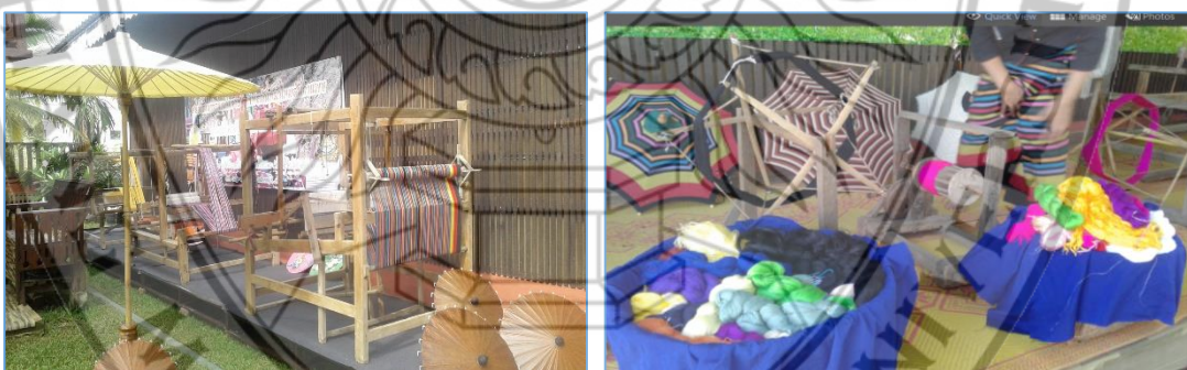
ภาพที่ 2.4 อุปกรณ์ในการทอผ้าจัดแสดงที่ ศูนย์วัฒนธรรมเฉลิมราช พิพิธภัณฑท์ผ้าไหมสันกำแพง

เนื่องจาก นายอนันต์ สุคันธรส มีความสนใจในการที่จะศึกษาองค์ความรู้ทางการทอผ้าไหมสันกำแพง และลวดลายบนผืนผ้าในอดีต จนรวบรวมผ้าฝ้ายและผ้าไหม สันกำแพงไว้จำนวนมากกว่าหนึ่งพันผืน ตลอดจนอุปกรณ์ในการทอผ้าในอดีต (อนันต์ สุคันธรส, 2556 : 54) และได้จัดทำงานวิจัยเพื่อเก็บรวบรวมข้อมูลเกี่ยวกับความเป็นมาและรายละเอียดของผ้าไหมที่เป็นของชุมชนสันกำแพงแต่เดิม เพื่อเป็นประโยชน์ต่อการศึกษาเรียนรู้ของคนในท้องถิ่น ตลอดจนการส่งเสริมให้ผ้าไหมสันกำแพงเป็นผลิตภัณฑ์ที่สามารถสร้างรายได้ให้แก่ประชาชนสันกำแพง จึงได้มีแนวคิดในการก่อตั้งเป็นศูนย์เรียนรู้ในรูปแบบของพิพิธภัณฑท์เพื่อเป็นแหล่งเรียนรู้ของคนในชุมชนและนักท่องเที่ยวที่มีความสนใจตลอดจนสร้างชื่อเสียงให้เป็นที่รู้จักในวงกว้าง