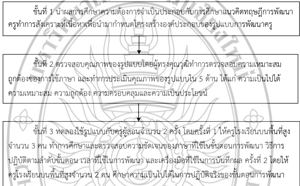
ภาพที่ 3.2 วิธีดำเนินการวิจัยระยะที่ 2

การสร้างรูปแบบการพัฒนาสมรรถนะของครูโรงเรียนบนพื้นที่สูงในการจัดการเรียนรู้ ด้านสุขอนามัย