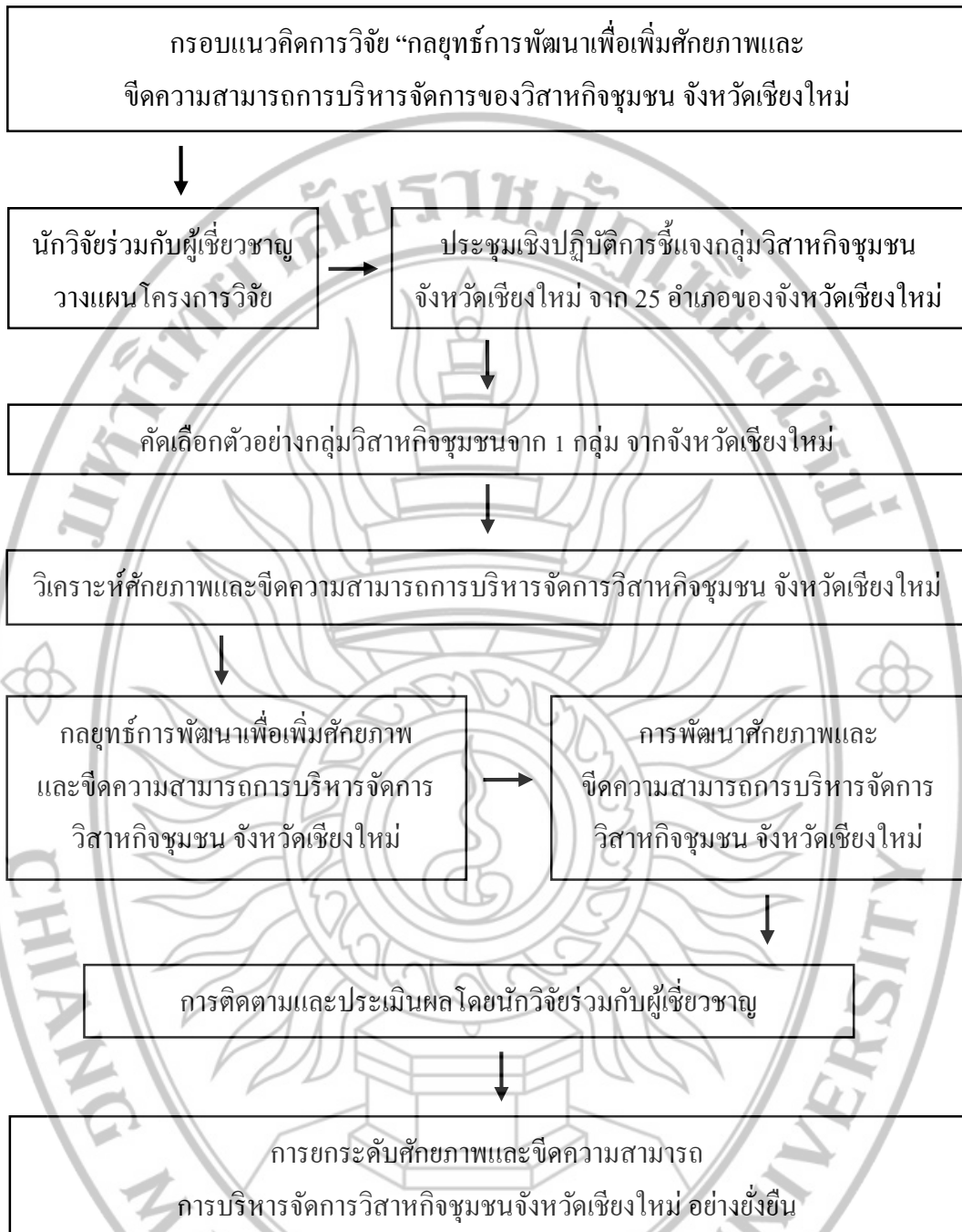
ภาพที่ 3.2 แผนงานวิจัยกลยุทธ์การพัฒนาเพื่อเพิ่มศักยภาพ และขีดความสามารถการบริหารจัดการของวิสาหกิจชุมชน จังหวัดเชียงใหม่