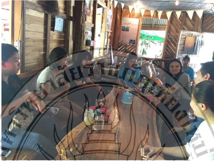
เข้าพบกลุ่มเกษตรกร อบต.แม่ทา