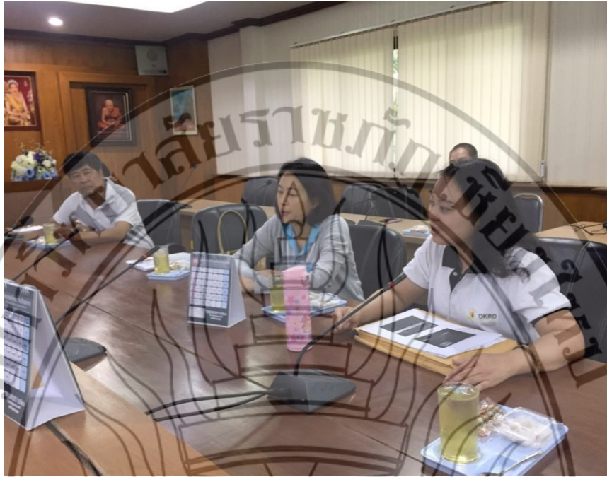
เข้าพบกลุ่มเกษตรกรผู้ปลูกหอมหัวใหญ่ อบต.น้ำป่อหลวง