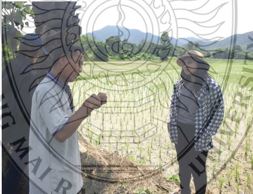
ลงพื้นที่เพื่อสำรวจแปลงปลูกข้าว เทศบาลตำบลออนใต้