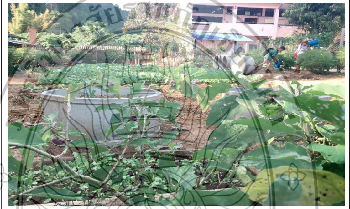
ภาพที่ 8 ผลผลิตโครงการวิจัย