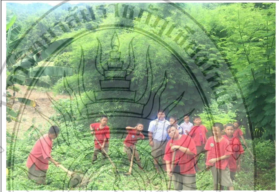
ภาพที่ 6 กิจกรรมโครงการวิจัย