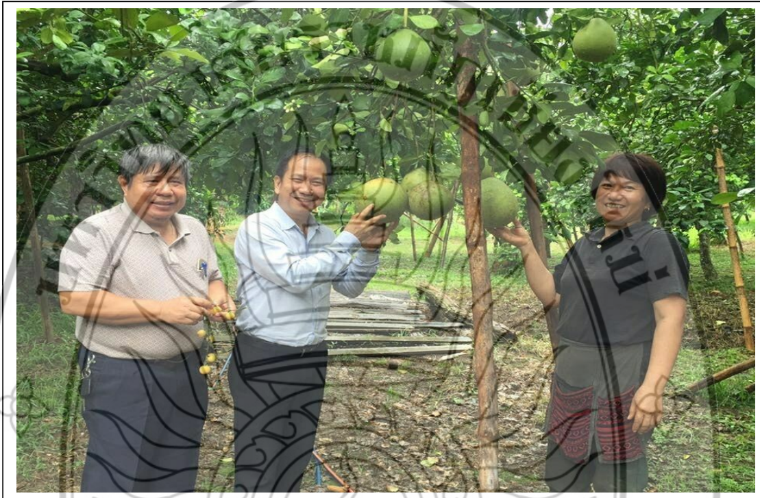
ภาพที่ 4 ลงพื้นที่เก็บข้อมูลวิจัย