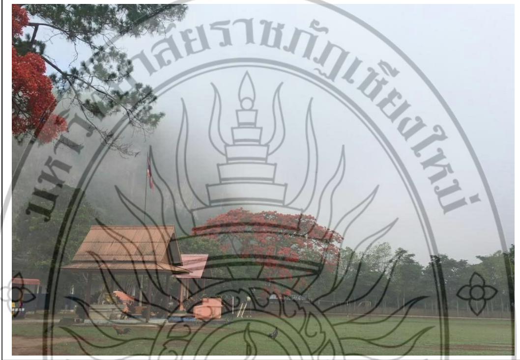
ภาพที่ 2 สภาพบริเวณพื้นที่วิจัย