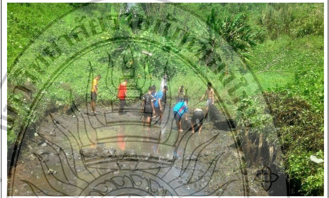
ภาพที่ 10 ผลผลิตโครงการวิจัย