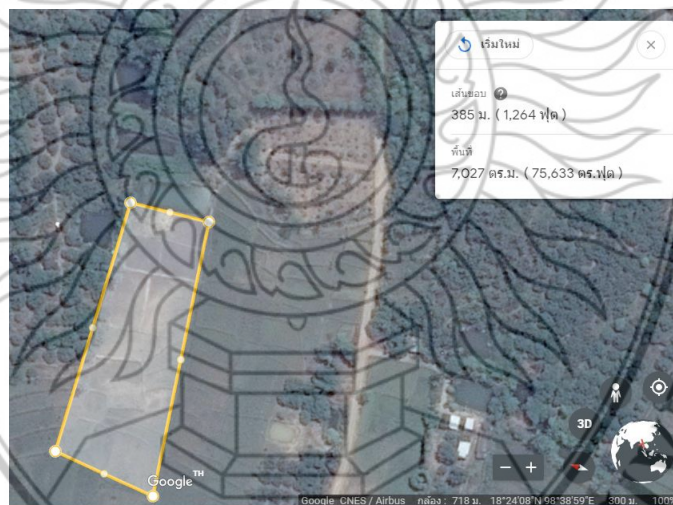
ภาพที่ 3.4 พื้นที่นาข้าวอินทรีย์ บ้านใหม่แม่เตี้ยะ ตำบลดอยแก้ว อำเภอจอมทอง จังหวัดเชียงใหม่ (เส้นสีเหลือง หมายถึง เส้นทางเดินสำรวจ)