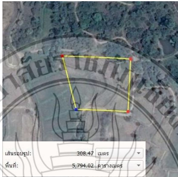
ภาพที่ 3.3 พื้นที่นาข้าวอินทรีย์ บ้านใหม่แม่เตี้ยะ ตำบลดอยแก้ว อำเภอจอมทอง จังหวัดเชียงใหม่ (เส้นสีเหลือง หมายถึง เส้นทางเดินสำรวจ)