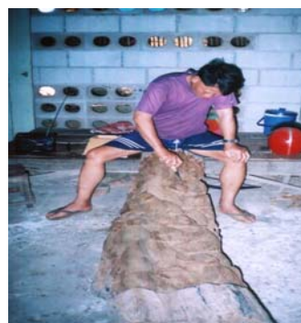
ตกแต่งเก็บรายละเอียด