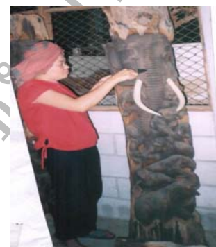
ตกแต่งสี