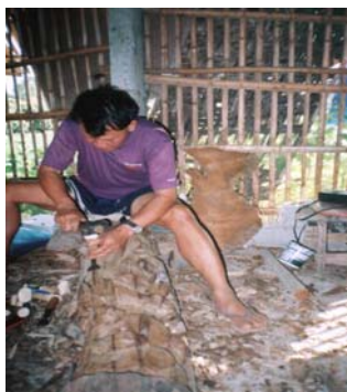
การแกะสลัก