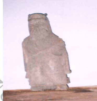
รูปแกะสลักเทพเจ้าชกลกชีวะ