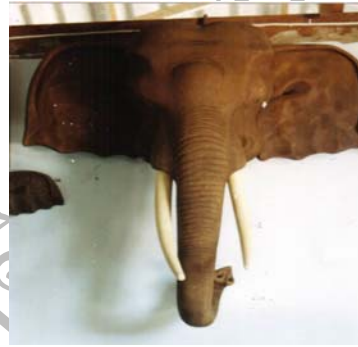
รูปแกะสลักหัวช้าง