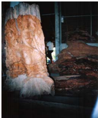
รูปแกะสลักนางเงือก