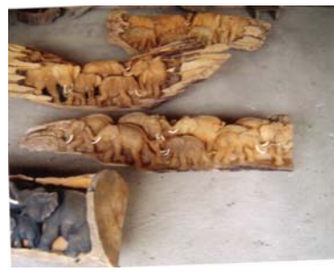
รูปแกะสลักช้างในรากไม้