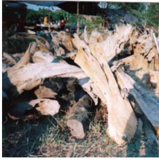
จัดหาไม้เพื่อการผลิต