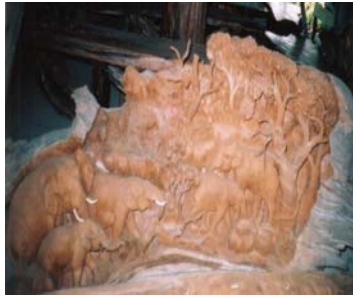
รูปแกะสลักโขลงช้างในป่า