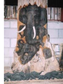
ช้างในโพลงไม้