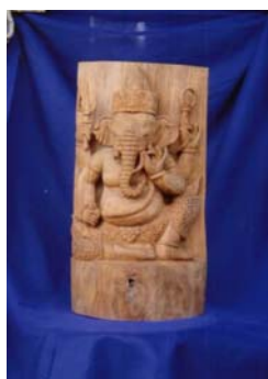
พระพิฆเนศ