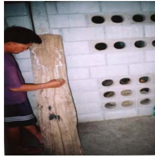
ออกแบบพิจารณาจากท่อนไม้