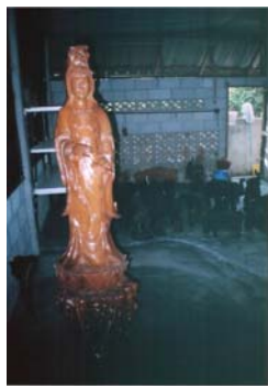
เจ้าแม่กวนอิมยืน

นอกจากนี้ในส่วนของสมาชิกยังมีการจ้างงานในบางกระบวนการผลิต ได้แก่ การตัดไม้ท่อนเป็นแผ่นเพื่อนำไปทำการแกะสลัก อัตราค่าจ้างแผ่นละ 40 ถึง 50 บาท ค่าจ้างฉลุแผ่นไม้ อัตราค่าจ้างแผ่นละ 50 บาท ค่าจ้างตกแต่งลวดลายผิวหนังช้าง ชุดละ 10 ถึง 55 บาท ขึ้นอยู่กับขนาดและจำนวนตัวช้างที่ทำการตกแต่งลวดลาย ค่าจ้างลงสีผลิตภัณฑ์ รายวัน 120 บาทต่อคน ค่าจ้างตกแต่งลวดลายบนผิวช้าง รายวัน 150 บาท ต่อวัน ค่าเลื่อยไม้เป็นแผ่น มีสมาชิกกลุ่มรับจ้างเลื่อยไม้ 2 ราย 30 ถึง 60 บาท ต่อแผ่น ค่าฉลุไม้แผ่น มีสมาชิกกลุ่มงานหัตถกรรมไม้แกะสลักรับจ้างทำการฉลุไม้จำนวน 1 ราย อัตราค่าจ้างฉลุไม้แผ่นละ 30 ถึง 50 บาท ภาพตัวอย่างการจ้างงานที่ 4.4