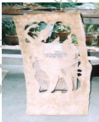
รูปแกะสลักกินรี