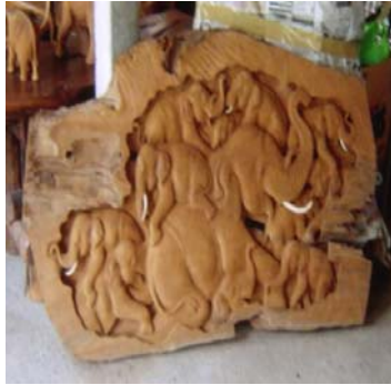
รูปแกะสลักช้างโพลง