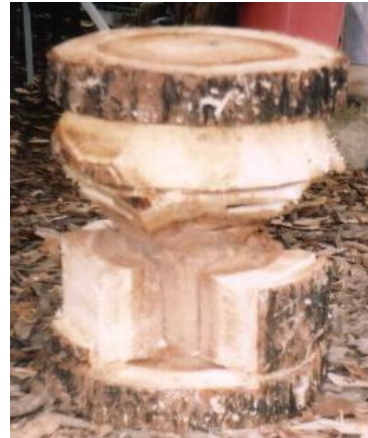
ตัวอย่างไม้จำฉา