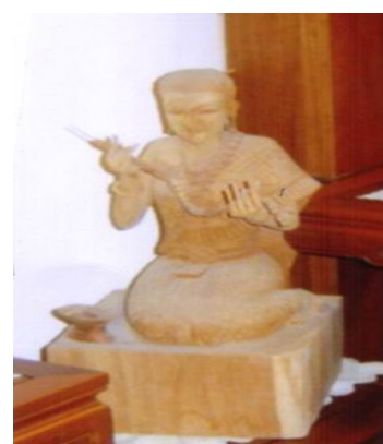
รูปแกะสลักนางร้อยมาลัย