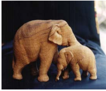
รูปแกะสลักเหมือนช้าง