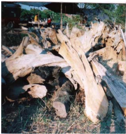
ตัวอย่างไม้สัก

ไม้จำฉา หรือไม้จามจรี เป็นไม้ที่กลุ่มฯ ไม่ได้ใช้ในการแกะสลัก แต่มีสมาชิกบางรายนำมาใช้เป็นวัตถุดิบในการแกะสลัก คิดเป็นสัดส่วนร้อยละ 30 ของไม้ที่สมาชิกนำมาใช้ในการผลิตทั้งหมด ใช้ในการทำผลิตภัณฑ์ช้างต่างๆ เช่น ช้างอึ่ง หรือช้างที่ใช้เป็นแก้วอเล็ก โต้ะแก้ว กระจ่าง เป็นต้น ภาพตัวอย่างไม้ที่ 4.2