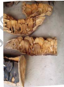
ช้างในรากไม้