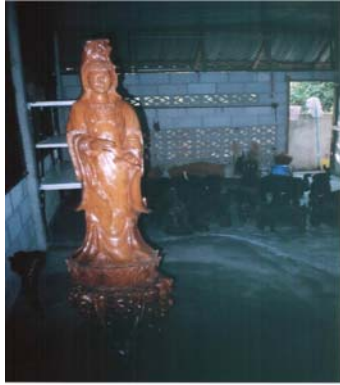
รูปแกะสลักเจ้าแม่กวนอิม

รูปแกะสลักนางร้อยมาลัย เป็นการแกะสลักไม้ท่อนให้เป็นรูปของหญิงไทยโบราณ แต่งกายชุดไทย นุ่งผ้าถุงห่มสไบ นั่งพับเพียบร้อยมาลัย ภาพตัวอย่างการจ้างงานประเภทเทพเจ้าดูภาพ ที่ 4.6