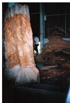
นางเงือก