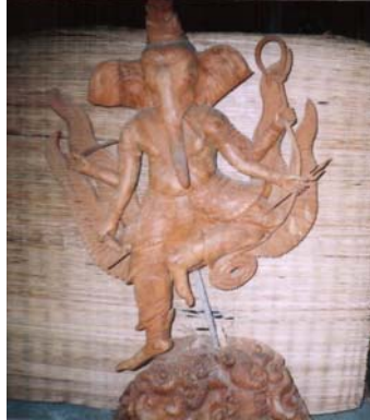
รูปแกะสลักพระพิฆเนศ