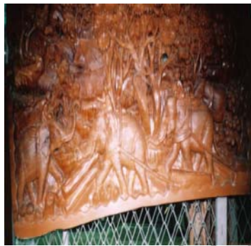
รูปแกะสลักช้างลากซุง