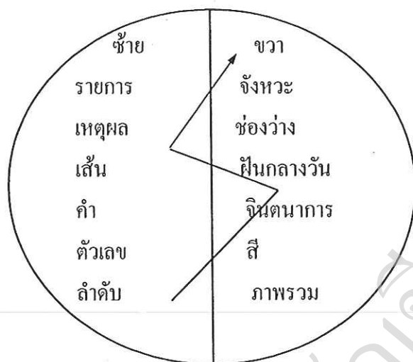
ภาพที่ 2.1 แผนภาพแสดงทักษะของสมอง

สมองแต่ละซีกมีทักษะที่เด่นและเหมาะสมต่างกัน โดยจะสื่อสารกลับไปกลับมาคล้ายๆ กับคนสองคน (แวนด้า นอร์ธ และ โทนี บูชาน, 2541:22)