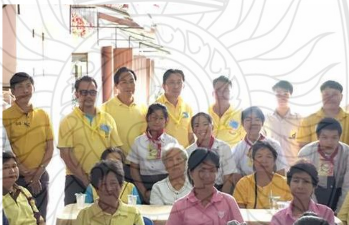
ภาพที่ 4.3 ภาพการลงพื้นที่ สํารวจสอบถาม