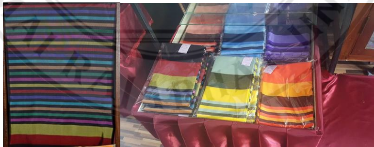
ภาพที่ 4.1 ผลิตภัณฑ์ผ้าชิ้น สั้นกำแพง

จากการเข้าศึกษาข้อมูลการผลิตจากผ้าชิ้นสั้นกำแพง ตำบลสันกำแพง อ.สันกำแพง จังหวัดเชียงใหม่ โดยการผลิตสินค้าทั้งหมดนั้นจัดทำโดยสมาชิกส่วนใหญ่เป็นกลุ่มสตรีและผู้สูงอายุทั้ง โดยใช้วัสดุและแรงงานภายในชุมชน กลุ่มวิสาหกิจชุมชน อ.สันกำแพง จังหวัดเชียงใหม่ ผลิตภัณฑ์เดิมคือ ผ้าชิ้นสั้นกำแพงจุดเด่นของผ้าไหมสั้นกำแพง คือ ลวดลายเฉพาะของสั้นกำแพง ซึ่งต่อมาได้มีการพัฒนามาเป็น “ลาย 7 วัน” คือการใส่สี 7 สีตามวันใน 1 สัปดาห์ หรือเรียกว่า เชิง 7 วัน จากนั้นก็มีลายวงเดือน ลายน้ำไหล ซึ่งมีเฉพาะที่สั้นกำแพงเท่านั้น ซึ่งรูปแบบมีความเป็นเอกลักษณ์อยู่แล้ว และวัสดุทำผ้าซึ่งหาได้ในชุมชนและใกล้เคียง