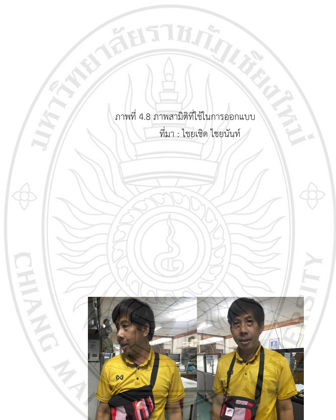
ภาพที่ 4.8 ภาพสามมิติที่ใช้ในการออกแบบ