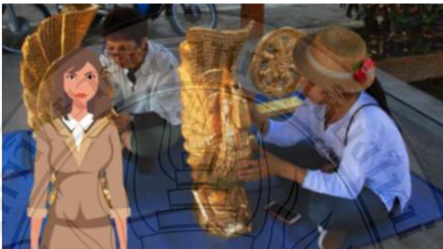
ภาพที่ 4.4 ตัวอย่างสื่อประสมตามหลักสูตรท้องถิ่น เรื่อง การจัดการเรียนรู้การแกะสลักไม้ ฉากงานแกะสลักไม้