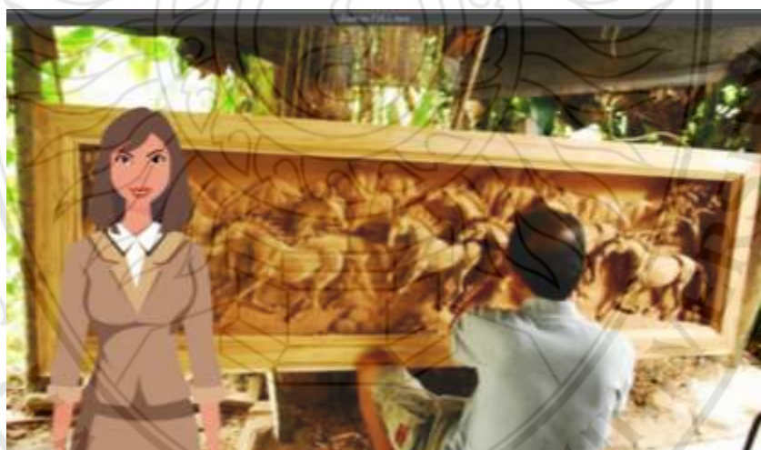
ภาพที่ 4.3 ตัวอย่างสื่อประสมตามหลักสูตรท้องถิ่น เรื่อง การจัดการเรียนรู้การแกะสลักไม้ ฉากงานแกะสลักไม้