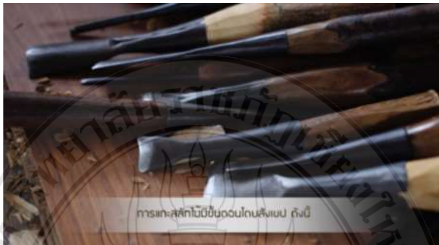
ภาพที่ 4.10 ตัวอย่างสื่อประสมตามหลักสูตรท้องถิ่น เรื่อง การจัดการเรียนรู้การแกะสลักไม้ ฉากขั้นตอนการแกะสลักไม้