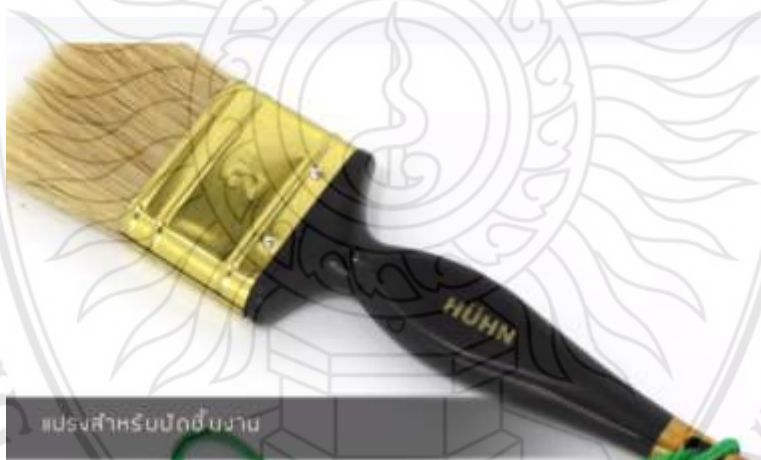
ภาพที่ 4.9 ตัวอย่างสื่อประสมตามหลักสูตรท้องถิ่น เรื่อง การจัดการเรียนรู้การแกะสลักไม้ ฉากวัสดุแกะสลักไม้