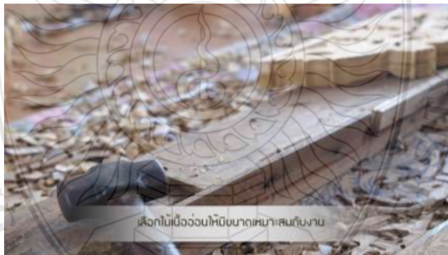
ภาพที่ 4.11 ตัวอย่างสื่อประสมตามหลักสูตรท้องถิ่น เรื่อง การจัดการเรียนรู้การแกะสลักไม้ ฉากขั้นตอนการเลือกลักษณะของไม้