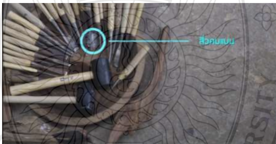
ภาพที่ 4.7 ตัวอย่างสื่อประสมตามหลักสูตรท้องถิ่น เรื่อง การจัดการเรียนรู้การแกะสลักไม้ ฉากอุปกรณ์แกะสลักไม้