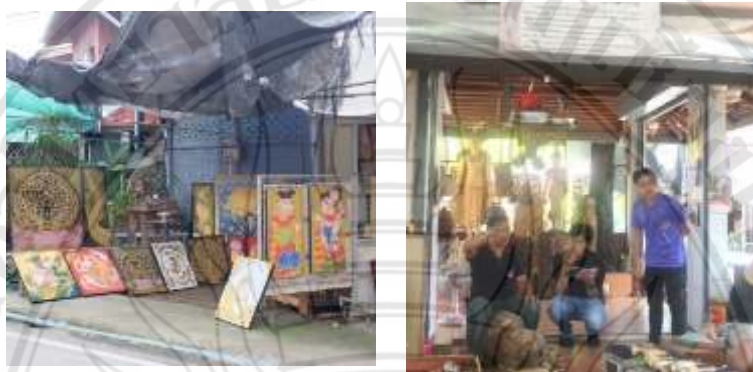
ภาพที่ 4.1 ภาพแสดงบริบทแกะสลักไม้ในชุมชนบ้านถวาย

บ้านถวายในปัจจุบันเป็นศูนย์รวมงานศิลปหัตถกรรม มีทั้งผลิตภัณฑ์ที่ขึ้นชื่อในหมู่บ้านและที่มาจากแหล่งอื่นแล้วนำมาตกแต่งสร้างมูลค่าเพิ่มในหมู่บ้านถวายจึงของนำเสนอรายละเอียดโดยสังเขป ดังนี้