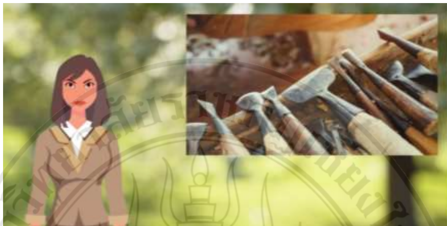
ภาพที่ 4.6 ตัวอย่างสื่อประสมตามหลักสูตรท้องถิ่น เรื่อง การจัดการเรียนรู้การแกะสลักไม้ ฉากอุปกรณ์แกะสลักไม้