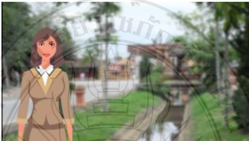
ภาพที่ 4.2 ตัวอย่างสื่อประสมตามหลักสูตรท้องถิ่น เรื่อง การจัดการเรียนรู้การแกะสลักไม้ ฉากนำเข้าสู่สื่อประสมการจัดการเรียนรู้การแกะสลักไม้