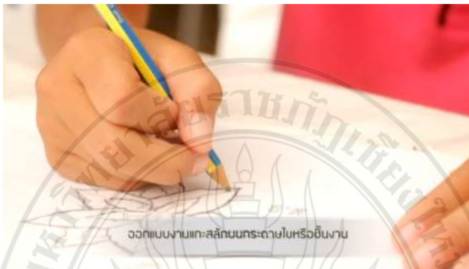
ภาพที่ 4.12 ตัวอย่างสื่อประสมตามหลักสูตรท้องถิ่น เรื่อง การจัดการเรียนรู้การแกะสลักไม้ จากออกแบบงานแกะสลักบนกระดาษใบ