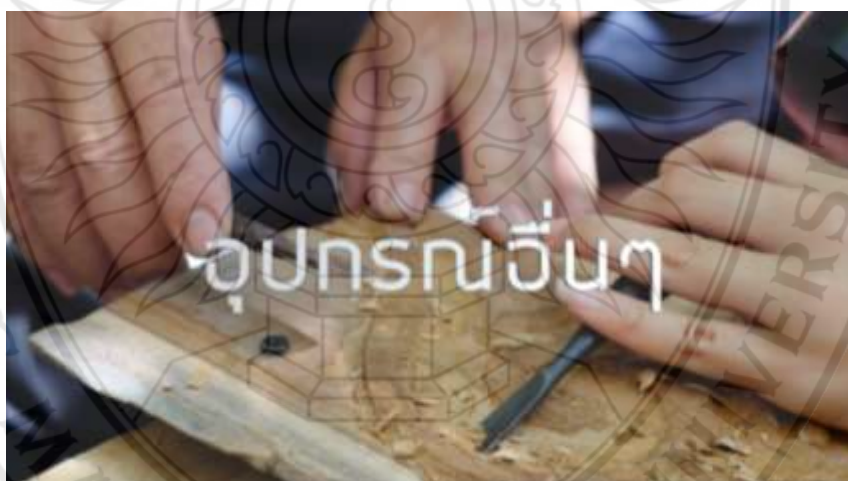
ภาพที่ 4.5 ตัวอย่างสื่อประสมตามหลักสูตรท้องถิ่น เรื่อง การจัดการเรียนรู้การแกะสลักไม้ ฉากวัสดุอุปกรณ์แกะสลักไม้