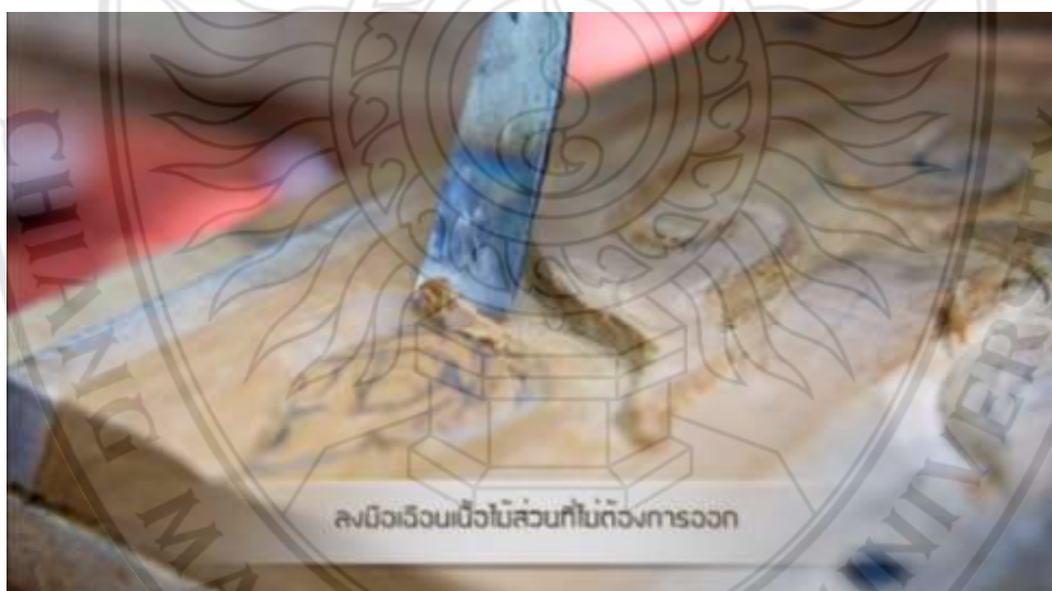
ภาพที่ 4.13 ตัวอย่างสื่อประสมตามหลักสูตรท้องถิ่น เรื่อง การจัดการเรียนรู้การแกะสลักไม้ จากการลงมือเขียนเนื้อส่วนที่ไม่ต้องการออก