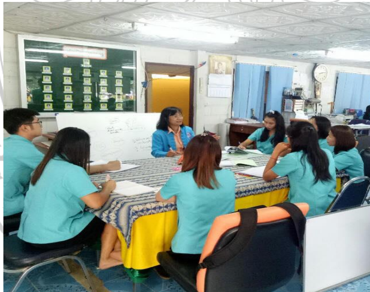
ประธานการประชุมกล่าวสรุปผล การตรวจสอบ แนวทางการบริหารงานวิชาการ โรงเรียนบนพื้นที่สูง สังกัดสำนักงานเขตพื้นที่การศึกษาประถมศึกษาเชียงใหม่ เขต 3