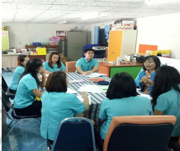
ผู้เข้าร่วมประชุมร่วมแสดงความคิดเห็นเกี่ยวกับ แนวทางการบริหารงานวิชาการ โรงเรียนบนพื้นที่สูง สังกัดสำนักงานเขตพื้นที่การศึกษาประถมศึกษาเชียงใหม่ เขต 3