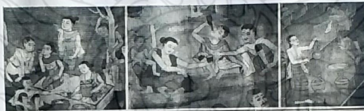
ภาพฉาก แสดงวิถีชีวิตชาวบ้าน กินเหล้า เลี้ยงลูก สบซั้ว สักหมักดำ