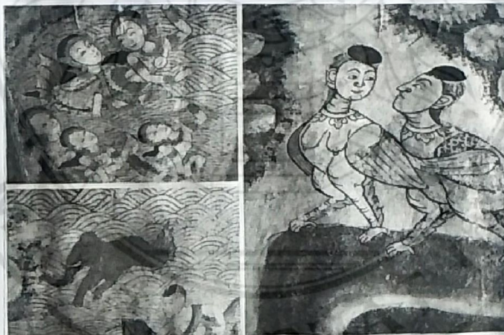
ภาพประกอบพวกนางเจ๊อก กิณนร กิณรี ช้างน้ำ ม้าน้ำ ที่หนานโปธาได้ รับอิทธิพลมาจากจิตรกรรมฝาผนังกรุงรัตนโกสินทร์