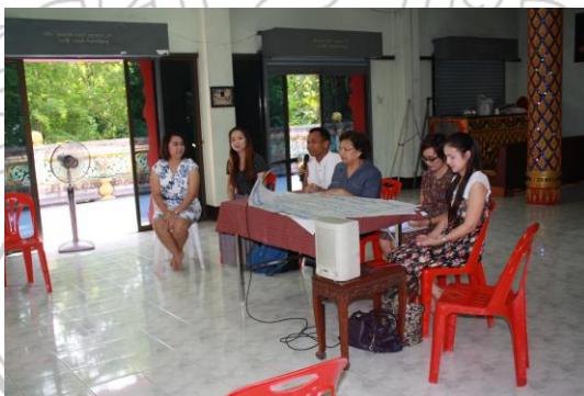
ภาพที่ 1 การเผยแพร่ผลการวิจัยเชิงพื้นที่

9.1 ผู้รับผิดชอบแผนงานวิจัยได้เชิญชวนคณาจารย์ของคณะมนุษยศาสตร์และสังคมศาสตร์ ซึ่งมีประสบการณ์ในการทำวิจัยน้อยมาร่วมรับฟังผลการวิจัยเชิงพื้นที่ เพื่อเป็นการสร้างความรับผิดชอบต่อชุมชน และสังคม ตามหน้าที่ความรับผิดชอบต่อ และ ตามปณิธานของมหาวิทยาลัย