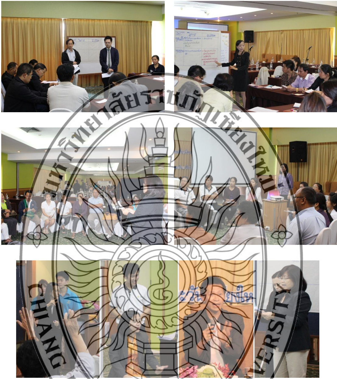
วิทยากร และคณะนักวิจัยของ ม.ราชภัฏเชียงใหม่ บูรณาการทำงานในการอบรมเชิงปฏิบัติการ การวิเคราะห์ต้นทุนและผลตอบแทนของกลุ่มท่องเที่ยว จังหวัดเชียงใหม่