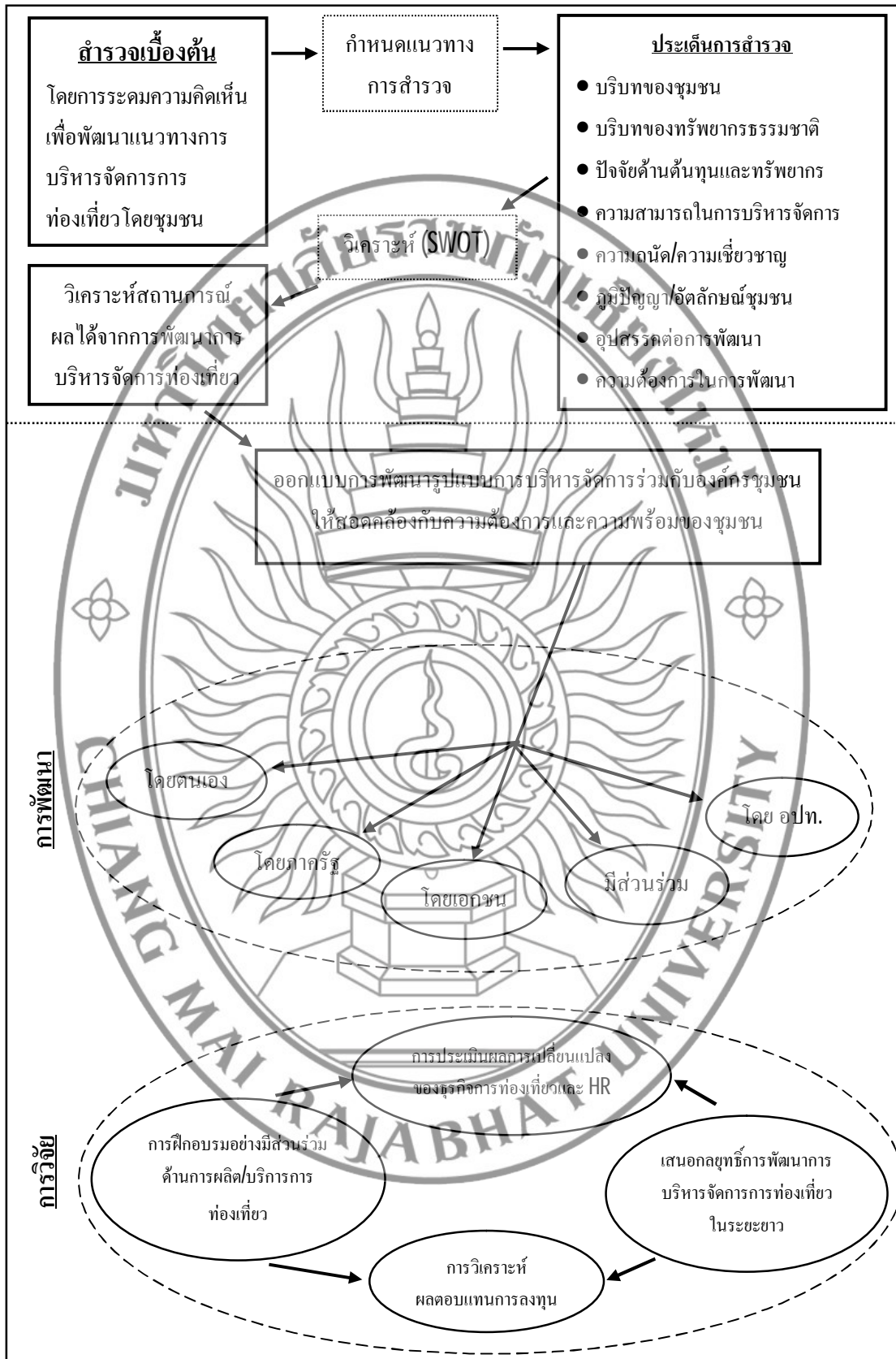
ภาพที่ 3.2 แบบจำลองของโครงการการพัฒนาศักยภาพ การบริหารจัดการการท้องถิ่นโดยชุมชน จังหวัดเชียงใหม่