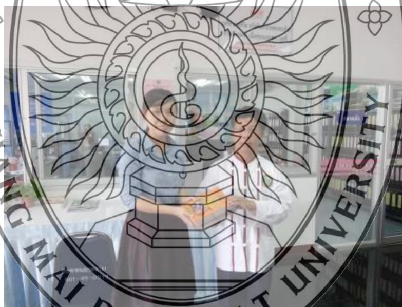
ภาพที่ 5.5 การมอบหนังสือคำพทานุกรมฯ แก่ตัวแทนเทศบาลตำบลหนองควาย