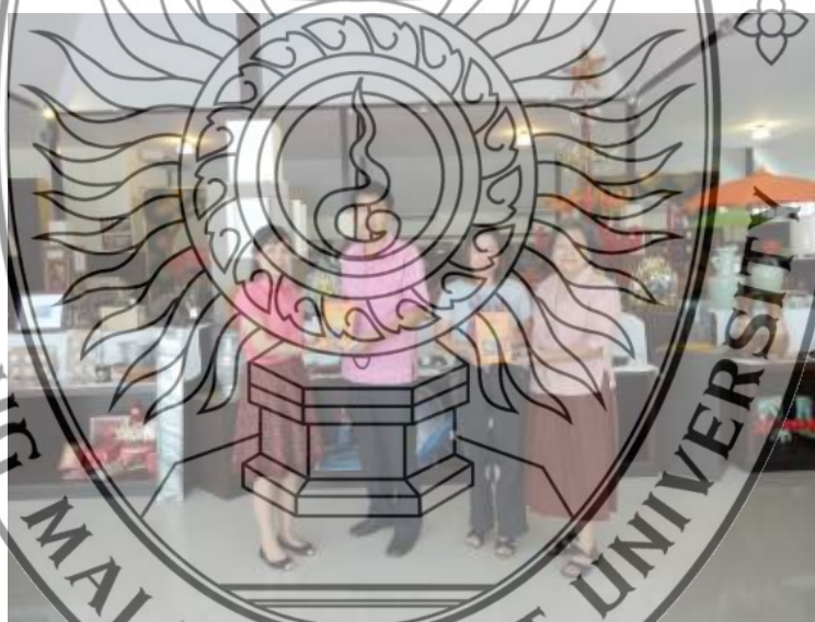
ภาพที่ 5.7 การมอบหนังสือสำนักงานกรมฯ แก่ศูนย์ส่งเสริมจำหน่ายและกระจายสินค้า OTOP สันกำแพง