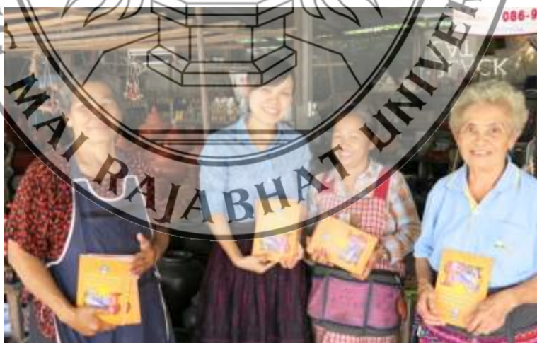
ภาพที่ 5.3 การมอบหนังสือศัพทานุกรมฯ แก่ตัวแทนชุมชนบ้านเหมืองงู