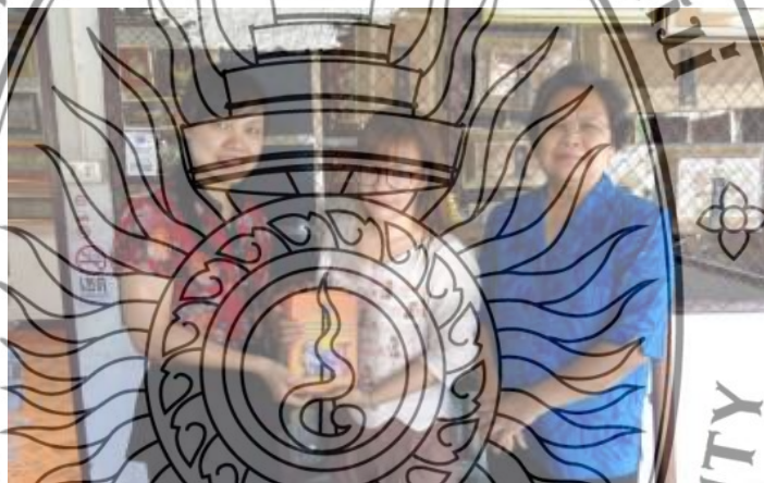
ภาพที่ 5.2 การมอบหนังสือศัพทานุกรมฯ แก่วิศากิจชุมชนวัดศรีสุพรรณ

4.1.4 คณะผู้วิจัยได้มอบหนังสือศัพทานุกรมให้กับศูนย์ส่งเสริมอุตสาหกรรมภาคเหนือ จังหวัดเชียงใหม่ เทศบาลตำบลหางดง อำเภอหางดง จังหวัดเชียงใหม่ เทศบาลตำบลเหมืองงู อำเภอหางดง จังหวัดเชียงใหม่ และศูนย์ส่งเสริมจำหน่าย และกระจายสินค้า OTOP อำเภอสันกำแพง จังหวัดเชียงใหม่ เพื่อนำไปใช้ในการเผยแพร่สินค้าชุมชนสู่ภายนอกพื้นที่ และสู่สากล และเพื่อใช้เป็นเอกสารอ้างอิงในการจัดทำเอกสารอื่นๆต่อไป