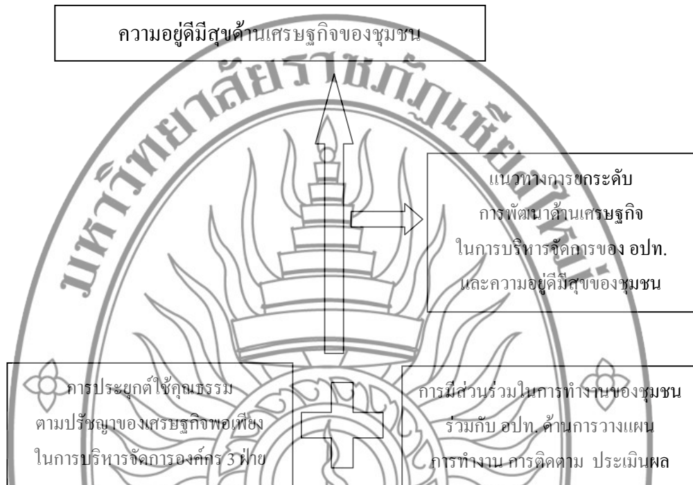
ภาพที่ 3.1 กรอบแนวคิดของการวิจัย

การพัฒนาตามกรอบแนวคิดการวิจัยสามารถแสดงได้ดังแบบจำลองการวิจัย (ภาพที่ 3.1) และแผนการดำเนินงาน โครงการวิจัย (ภาพที่ 3.2) ดังนี้