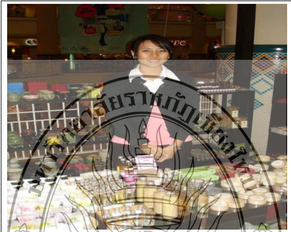
ภาพที่ 3 การทดสอบตลาด ณ ร้านจีน เซ็นทรัลแอร์พอร์ตพลาซ่า