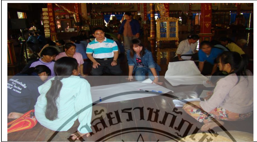
ภาพที่ 2 โครงการอบรมเชิงปฏิบัติการแบบมีส่วนร่วม เรื่องการสังเคราะห์แผนการตลาดในผลิตภัณฑ์จากน้ำมันงา ถั่วแปบหล่อ แปยี ถั่วลิสงคั่ว และถั่วเน่าแผ่น

จากภาพที่ 2 การอบรมได้แผนการตลาดที่จะนำไปบริหารการตลาดของผลิตภัณฑ์จากน้ำมันงา ถั่วแปบหล่อ แปยี ถั่วลิสงคั่ว และถั่วเน่าแผ่น