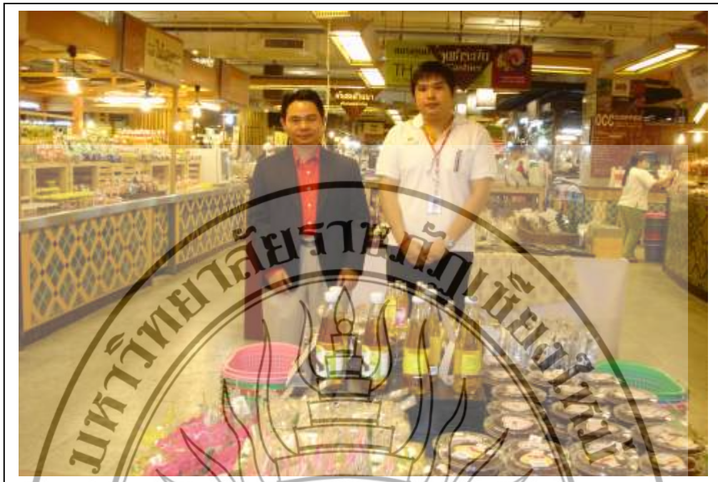
ภาพที่ 1 การทดสอบตลาด ณ ตลาดหลวง เซ็นทรัลแอร์พอร์ตพลาซ่า