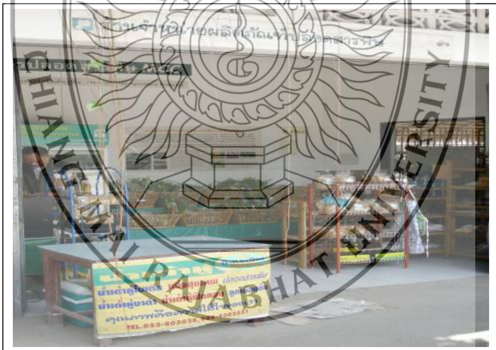
ภาพที่ 2 การทดสอบตลาด ณ ศูนย์วิจัยฯ คณะเกษตร มหาวิทยาลัยเชียงใหม่