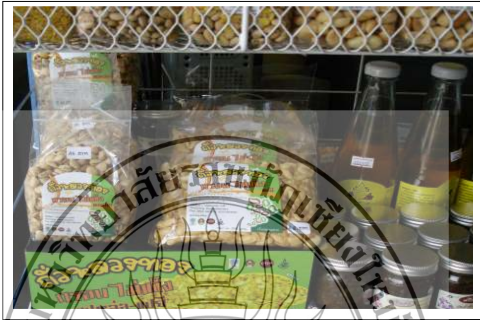
ภาพที่ 5 การวางตลาด ณ ร้านของฝากวันสนั่นเพื่อสร้างการรับรู้