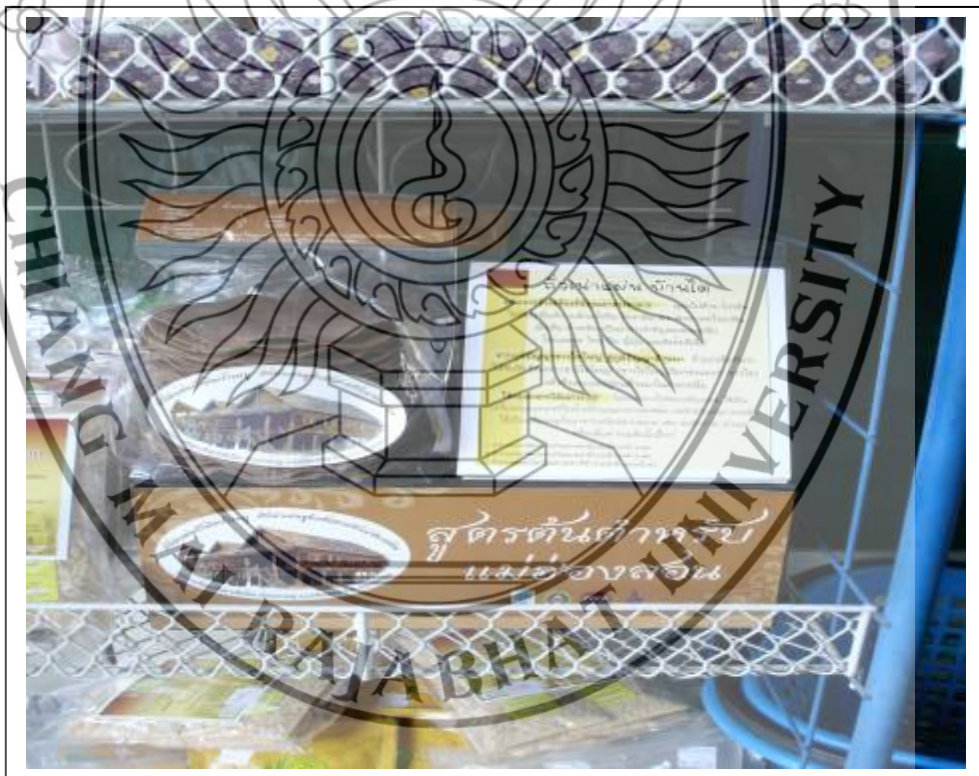
ภาพที่ 6 การวางตลาด ณ ร้านของฝากทองเพื่อสร้างการรับรู้