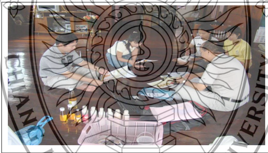
ภาพที่ 3 โครงการอบรมเชิงปฏิบัติการแบบมีส่วนร่วมเรื่อง การบริหารการตลาดในผลิตภัณฑ์จากน้ำมันงา ถั่วแปบหล่อ แปยี ถั่วลิสงคั่ว และถั่วเน่าแผ่น

จากภาพที่ 2 การอบรมได้แผนการตลาดที่จะนำไปบริหารการตลาดของผลิตภัณฑ์จากน้ำมันงา ถั่วแปบหล่อ แปยี ถั่วลิสงคั่ว และถั่วเน่าแผ่น