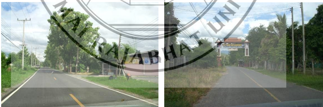
ภาพที่ 4.4 สภาพการคมนาคมระหว่างตำบลในอำเภอคอยสะเก็ด จังหวัดเชียงใหม่

การคมนาคมมีถนนสำคัญที่ตัดผ่านอำเภอ คือ ทางหลวงแผ่นดินหมายเลข 1007 สถานีขนส่ง หมายเลขโทรศัพท์ 118 และสถานีรถไฟ หมายเลขโทรศัพท์ 1014 ผู้ชุมชนทุกตำบล หมู่บ้านซึ่งมียานพาหนะใช้สัญจรไปมา แต่ละวันเป็นจำนวนมากกรมทางหลวงได้ปรับปรุงขยายถนนให้กว้างและดีขึ้นกว่าเดิม ทำให้การสัญจรไปมาสะดวกขึ้น แต่มีจุดที่ต้องดำเนินการเพิ่มเติม เช่น ติดตั้งสัญญาณไฟจราจร (ไฟเขียวไฟแดง) และทางม้าลายตามเขตชุมชนหนาแน่น หรือที่มีการสัญจรพลุกพล่าน และบริเวณหน้าสถานศึกษา เป็นต้น