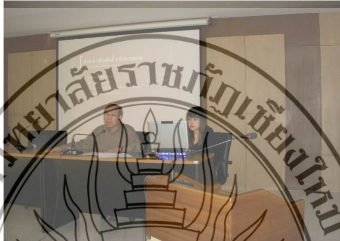
ภาพที่ 4.5 การลงพื้นที่ของคณะผู้วิจัย จากมหาวิทยาลัยราชภัฏเชียงใหม่

การจัดการการตลาด การเงิน การบัญชี เป็นต้น ดังภาพที่ 4.5