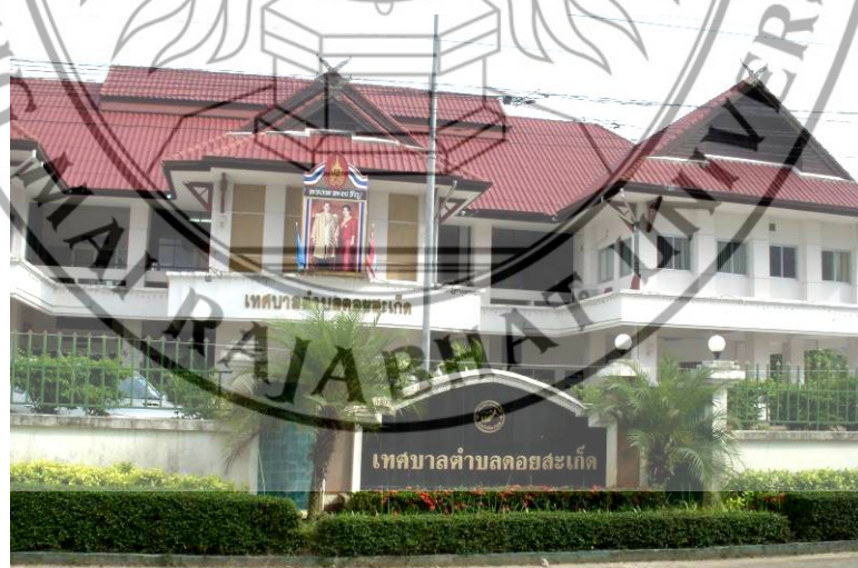
ภาพที่ 4.3 เทศบาลตำบลคอยสะเก็ด อำเภอคอยสะเก็ด จังหวัดเชียงใหม่

คอยสะเก็ดได้จัดตั้งเป็นอำเภอ เมื่อปี พ.ศ. 2445 โดยมีตำบลเชิงคอยเป็นศูนย์กลางในอำเภอ ปัจจุบันมี 14 ตำบล คือ ตำบลเชิงคอย ตำบลสันปูเลย ตำบลลวงเหนือ ตำบลป่าป้อ ตำบลสง่าบ้าน ตำบลป่าลาน ตำบลตลาดขวัญ ตำบลลำราญราษฎร์ ตำบลแม่คือ ตำบลตลาดใหญ่ ตำบลแม่ฮ้อยเงิน ตำบลแม่โป่ง ตำบลป่าเมียง ตำบลเทพเสด็จ เทศบาลตำบลคอยสะเก็ดดูได้ดังภาพที่ 4.3