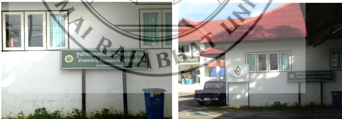
ภาพที่ 4.6 ศูนย์ถ่ายทอดเทคโนโลยีการเกษตรประจำตำบล อำเภอคอยสะเก็ด จังหวัดเชียงใหม่

เนื่องจากพื้นที่ตำบลแม่คือ ตำบลลวงใต้ ตำบลสันปูเลย ตำบลป่าเมี่ยง ตำบลแม่ฮ้อยเงิน อำเภอคอยสะเก็ด เป็นภูเขาที่มีป่าไม้สมบูรณ์ บางส่วนเป็นที่ราบลุ่มสลับภูเขา มีคลองชลประทานที่ใช้ทำการเกษตรมากมายไม่ว่าจะมาจากเขื่อนแม่กวงไหลผ่านในตำบล หรือจากแหล่งธรรมชาติที่สำคัญ ได้แก่ น้ำแม่กวง แม่น้ำดอกแดง น้ำแม่โป่ง น้ำแม่ฮ่องฮัก และหนองบัวพระเจ้าหลวง ส่วนที่เป็นที่ราบลุ่มซึ่งเหมาะแก่การประกอบอาชีพเพาะปลูก ทำให้ประชากรอำเภอคอยสะเก็ด มีอาชีพหลัก คือ การทำการเกษตร ได้แก่ ทำนา ทำสวน เป็นหลัก ผลผลิตทางการเกษตรที่สำคัญ คือ ข้าว กระเทียม ปลาโคเนื้อ โคนม ไข่เนื้อ และไข่ไก่ อาชีพรอง ได้แก่ รับจ้างทั่วไป และการแปรรูปผลผลิตทางการเกษตร เช่น การผลิตน้ำพริกเผา กุนเชียง แคบหมู คล้ายตาก สมุนไพรชง ชาชง แชมพู และน้ำยาล้างจาน งานหัตถกรรม คือ การผลิตโคมไฟ ผลิตภัณฑ์ป้ายชื่อ กรอบรูป แผ่นภาพ ตัดผนัง ผลิตภัณฑ์ผ้าชั้นทอมือ ถักย้อมทอมือ ผ้าคลุมไหล่ กระเป๋าผ้าฝ้าย รายได้เฉลี่ยของประชากรในตำบล 19,650 บาท ต่อคนต่อปี ถือเป็นรายได้ที่ยังไม่ดีพอสำหรับเกษตรกรเนื่องจากกลไกการตลาดบางปีมีผลผลิตมากทำให้ราคาผลผลิตตกต่ำ ขาดการนำเทคโนโลยีมาใช้ในการเกษตร ผู้บริโภคตื่นกลัว เนื่องจากเกษตรกรใช้สารเคมีในการเกษตรกรรมมากเกินไป เป็นต้น และในตำบลตลาดแม่คือ และตำบลอื่น ๆ ยังมีการส่งเสริม และถ่ายทอดเทคโนโลยีสมัยใหม่ ที่เกี่ยวกับการเกษตร เพื่อเป็นการพัฒนาเกษตรกรให้มีความรู้ใหม่ ในการทำเกษตรกรรมที่ไม่ต้องพึ่งสารเคมี โดยการเปิดศูนย์ถ่ายทอดเทคโนโลยีการเกษตรประจำตำบล ดังภาพที่ 4.6