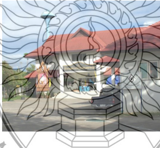
ภาพที่ 4.5 เทศบาลตำบลตลาดขวัญ อำเภอคอยสะแก็ค จังหวัดเชียงใหม่

คอยสะแก็ค ประมาณ 6.5 กิโลเมตร ซึ่งห่างจากศูนย์ราชการจังหวัดเชียงใหม่ประมาณ 13 กิโลเมตร ห่างจากเขตอำเภอเมืองเชียงใหม่ประมาณ 8 กิโลเมตร ตำบลตลาดขวัญ ตั้งอยู่ในเขตการปกครอง อำเภอคอยสะแก็ค จังหวัดเชียงใหม่ประกอบด้วย 6 หมู่บ้าน ได้แก่ หมู่ 1 บ้านพยาคอยแก้ว หมู่ 2 บ้านน้ำแพร่ หมู่ 3 บ้านถ้ำ หมู่ 4 บ้านบ่อหิน หมู่ 5 บ้านป่าแจะ หมู่ 6 บ้านพยากหลวง สภาพทั่วไปของตำบลตลาดขวัญมีภูมิประเทศส่วนใหญ่เป็นพื้นที่ราบลุ่ม พื้นที่ที่มีความลาดเอียงจากทิศตะวันตกเฉียงเหนือไปทางทิศตะวันออกเฉียงใต้ พื้นที่ของตำบลอยู่ในเขตรับน้ำ โครงการชลประทานแม่กวาง อุดมธารา อาณาเขตตำบลทาง ทิศเหนือ ติดกับ ตำบลสันป่าเปา อำเภอสันทราย จังหวัดเชียงใหม่ ทิศใต้ ติดกับ ตำบลสันปูเลย ทิศตะวันออก ติดกับ ตำบลป่าลาน ทิศตะวันตก ติดกับ ตำบลสันนาเม็ง อำเภอสันทราย จังหวัดเชียงใหม่จำนวนประชากรในเขต อบต. 3,750 คน แยกเป็นชาย 1,698 คน และหญิง 2,052 คน และจำนวนหลังคาเรือน 1,810 หลังคาเรือน ข้อมูลอาชีพหลักของตำบล ได้แก่ การทำนา ทำสวน ทำไร่ อาชีพเสริม คือ การรับจ้าง แปรรูปอาหาร ข้อมูลสถานที่สำคัญของตำบล ได้แก่ วัดบ้านป่าแจะ และเทศบาลตำบลตลาดขวัญ ดังภาพที่ 4.5