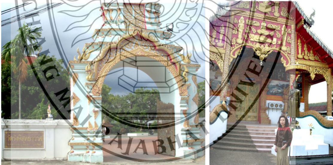
ภาพที่ 4.7 ภายนอก และภายในของวัดรังสีสุทธาวาส สถานที่สำคัญ ในตำบลเชิงคอย อำเภอคอยสะเก็ด จังหวัดเชียงใหม่ ซึ่งมีวัฒนธรรมของท้องถิ่นที่งดงาม และน่าอนุรักษ์เป็นอย่างยิ่ง

ลักษณะชุมชนในเขตอำเภอคอยสะเก็ด เป็นชุมชนเมืองกึ่งชนบท การดำรงชีวิตประจำวันประชากรส่วนใหญ่ยังคงความสัมพันธ์แบบเครือญาติ ให้ความสำคัญ และนับถือผู้อาวุโส วิถีชีวิตความเป็นอยู่เรียบง่าย มีการพึ่งพาอาศัยซึ่งกันและกัน ทำให้ประเพณีวัฒนธรรมดั้งเดิมส่วนใหญ่ยังคงรักษาสืบทอดจนถึงปัจจุบัน โดยมีวัดที่สำคัญในท้องถิ่นตำบลเชิงคอย ได้แก่ วัดรังสีสุทธาวาส และพิพิธภัณฑ์วิถีชีวิต และวัฒนธรรมใต้ลือ ดังภาพที่ 4.7 และภาพที่ 4.8