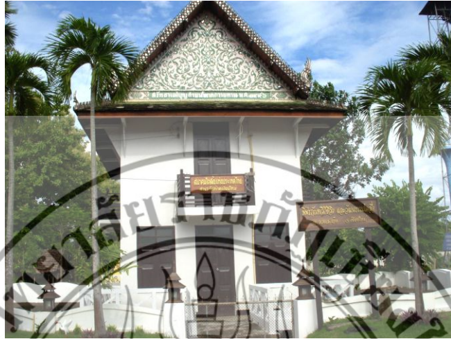
ภาพที่ 4.8 พิพิธภัณฑ์วิถีชีวิตและวัฒนธรรมไตลื้อ อำเภอดอยสะเก็ด จังหวัดเชียงใหม่