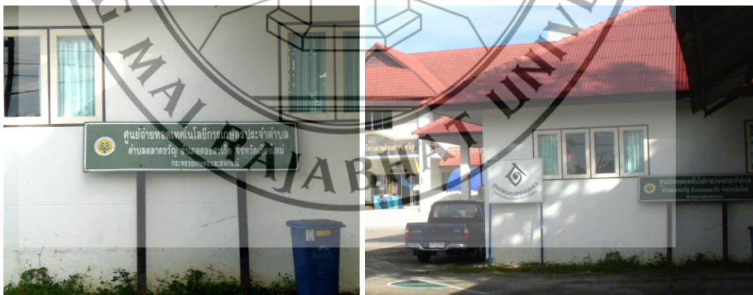
ภาพที่ 4.10 ศูนย์ถ่ายทอดเทคโนโลยีการเกษตรประจำตำบล อำเภอคอยสะเก็ด จังหวัดเชียงใหม่

เนื่องจากพื้นที่ของตำบลเชิงค้อย ตำบลตลาดขวัญ อำเภอคอยสะเก็ด เป็นภูเขาที่มีป่าไม้สมบูรณ์ บางส่วนเป็นที่ราบลุ่มสลับกันกับภูเขา มีคลองชลประทานที่ใช้ทำการเกษตรมากมาย ไม่ว่าจะเป็นจาก เขื่อนแม่กวงไหลผ่านในตำบล หรือจากแหล่งธรรมชาติที่สำคัญได้แก่ น้ำแม่กวง แม่น้ำดอกแดง น้ำแม่โป่ง น้ำแม่ฮ้องฮัก และหนองบัวพระเจ้าหลวง ส่วนที่เป็นที่ราบลุ่มซึ่งเหมาะแก่การประกอบอาชีพเพาะปลูก ทำให้ประชากรอำเภอคอยสะเก็ดมีอาชีพหลัก คือ การทำการเกษตร ได้แก่ ทำนา ทำสวน เป็นหลัก ผลผลิตทางการเกษตรที่สำคัญ คือ ข้าว กระจ่างม ปลาโคเนื้อ โคนม ไก่เนื้อ และไก่ไข่ อาชีพรอง ได้แก่ อาชีพรับจ้างทั่วไป และการแปรรูปผลผลิตทางการเกษตร เช่น การผลิตน้ำพริกเผา กุนเชียง แคบหมู ก๋วยเตี๋ยว ผงชูรส ชาชง แชมพู และน้ำยาล้างจาน งานหัตถกรรม คือ การผลิตโคมไฟ ผลิตภัณฑ์ป้ายชื่อ กรอบรูป แผ่นภาพติดผนัง ผลิตภัณฑ์ผ้าชิ้น ทอมือ ถูย้อมทอมือ ผ้าคลุมไหล่และกระเป๋าผ้าฝ้าย รายได้เฉลี่ยของประชากรในตำบล 19,650 บาท ต่อคนต่อปี ถือเป็นรายได้ที่ยังไม่ดีพอสำหรับเกษตรกรเนื่องจากกลไกการตลาดบางปีก็มีผลผลิตมาก ทำให้ราคาผลผลิตตกต่ำ ขาดการนำเทคโนโลยีมาใช้ในการเกษตรกรรม ผู้บริโภคตื่นกลัว เนื่องจากเกษตรกรใช้สารเคมีในการเกษตรกรรมมากเกินไป เป็นต้น และในตำบลตลาดขวัญ และตำบลอื่นๆ ยังมีการส่งเสริม และถ่ายทอดเทคโนโลยีสมัยใหม่ที่เกี่ยวข้องกับการเกษตร เพื่อการพัฒนาเกษตรกรให้มีความรู้ใหม่ๆ ในการทำเกษตรกรรมที่ไม่ต้องพึ่งสารเคมี โดยการเปิดศูนย์ถ่ายทอดเทคโนโลยีการเกษตรประจำตำบล ดังภาพที่ 4.10