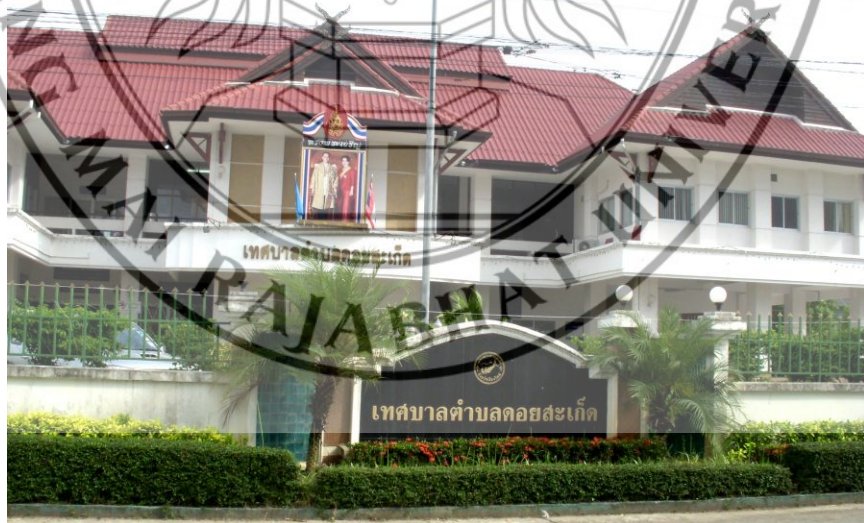
ภาพที่ 4.3 เทศบาลตำบลคอยสะเก็ด อำเภอคอยสะเก็ด จังหวัดเชียงใหม่

คอยสะเก็ดได้จัดตั้งเป็นอำเภอเมื่อปี พ.ศ. 2445 โดยมีตำบลเชิงคอยเป็นศูนย์กลางในอำเภอ ปัจจุบันมี 14 ตำบล คือ ตำบลเชิงคอย ตำบลสันปูเลย ตำบลดวงเหนือ ตำบลป่าป้อ ตำบลสง่าบ้าน ตำบลป่าลาน ตำบลตลาดขวัญ ตำบลตำราญราษฎร์ ตำบลแม่คือ ตำบลตลาดใหญ่ ตำบลแม่ฮ้อยเงิน ตำบลแม่โป่ง ตำบลป่าเมียง ตำบลเทพเสด็จ เทศบาลตำบลคอยสะเก็ดดูได้ดังภาพที่ 4.3