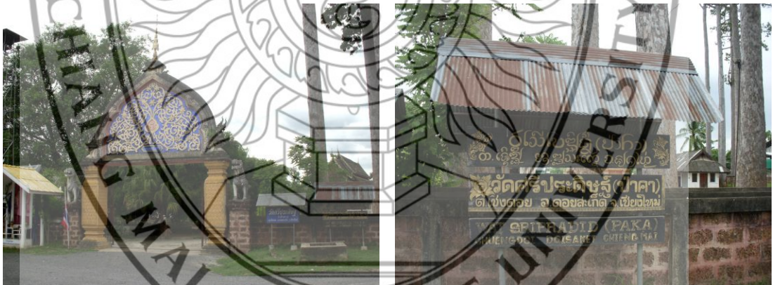
ภาพที่ 4.4 บริเวณวัดศรีประดิษฐ์ในตำบลเชิงคอย อำเภอคอยสะเร็ด จังหวัดเชียงใหม่

ตำบลเชิงคอย จัดตั้งเป็นองค์การบริหารส่วนตำบลเชิงคอยตามประกาศลงวันที่ 30 มีนาคม 2539 จำนวนหมู่บ้านในเขตตำบลตามลักษณะปกครองที่มีทั้งหมด 13 หมู่บ้าน สภาพทั่วไปของตำบลสภาพภูมิประเทศบางส่วนเป็นภูเขาที่มีป่าไม้สมบูรณ์ บางส่วนเป็นที่ราบลุ่ม มีคลองชลประทานจากเขื่อนแม่กวงไหลผ่าน นอกจากนี้มีหนองน้ำธรรมชาติที่สำคัญ คือ หนองบัว และหนองน้ำแม่ดอกแดง อาณาเขตตำบล ทิศเหนือติดกับตำบลวงเหนือ และตำบลป่าเมี่ยง ทิศใต้ติดกับตำบลป่าป้อ และตำบลป่าเมี่ยง ทิศตะวันออก ติดกับตำบลแม่โป่ง และตำบลป่าเมี่ยง ทิศตะวันตก ติดกับตำบลวงเหนือ และตำบลหนองแห้ง อำเภอสันทราย จังหวัดเชียงใหม่ จำนวนประชากรในเขต อบต. 6,642 คน จำนวนหลังคาเรือน 2,235 หลังคาเรือน อาชีพหลักคือการเพาะปลูกอาชีพเสริม คือ การเลี้ยงสัตว์ และงานหัตถกรรม สถานที่สำคัญของตำบล ได้แก่ ที่ว่าการอำเภอคอยสะเร็ด อบต.เชิงคอย วัดคอยสะเร็ด วัดปทุมसरาราม และวัดศรีประดิษฐ์ (ป่าคา) ดังภาพที่ 4.4