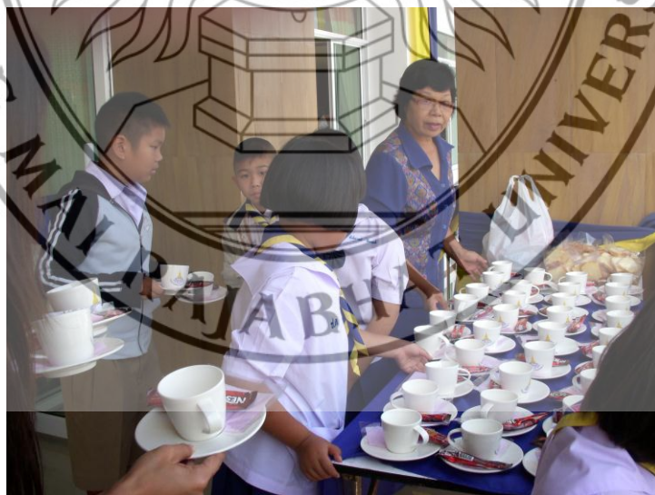
ภาพที่ 4.9 จัดงานวันเด็กแห่งชาติ ปี 2552 วันที่ 10 มกราคม 2552 ในอำเภอดอยสะเก็ด จังหวัดเชียงใหม่

6) เทศบาลตำบลดอยสะเก็ด ได้จัดงานวันเด็กแห่งชาติ ประจำปี 2552 ในวันที่ 10 มกราคม 2552 โดยในงานประกอบด้วย การแสดงของเด็ก ๆ การเล่นเกมส์ และการจัดกิจกรรมทางด้านส่งเสริมสุขภาพ ความคิดสร้างสรรค์ การแจกรางวัลจากหน่วยงานต่าง ๆ ที่ให้การสนับสนุน กิจกรรมอาทิ โรงพยาบาลอำเภอดอยสะเก็ด สถานีตำรวจอำเภอดอยสะเก็ด กศน. ชมรมเครื่องบินเล็กจากแม่โจ้ กองบิน 41 ซึ่งเด็ก ๆ และผู้ปกครองที่เข้าร่วมกิจกรรมกว่า 1,000 คน ต่างได้รับความสนุกสนาน ความรู้และความสุขในวันเด็กแห่งชาติ ตามคำขวัญวันเด็ก “ฉลาดคิด จิตบริสุทธิ์ จุดประกายฝัน ผูกพันรักสามัคคี”