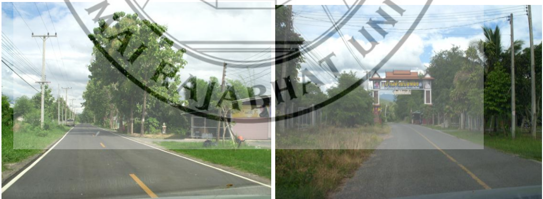
ภาพที่ 4.6 สภาพการคมนาคมระหว่างตำบล ในอำเภอดอยสะเก็ด จังหวัดเชียงใหม่

การคมนาคมมีถนนสำคัญที่ตัดผ่านอำเภอ คือ ทางหลวงแผ่นดินหมายเลข 1007 สถานีขนส่ง หมายเลขโทรศัพท์ 118 และสถานีรถไฟ หมายเลขโทรศัพท์ 1014 ผู้ชุมชนทุกตำบลหมู่บ้านซึ่งมียานพาหนะใช้สัญจรไปมาแต่ละวันเป็นจำนวนมากกรมทางหลวงได้ปรับปรุงขยายถนนให้กว้างและดีขึ้นกว่าเดิมทำให้การสัญจรไปมาสะดวกขึ้น แต่มีจุดที่ต้องดำเนินการเพิ่มเติม เช่น ติดตั้งสัญญาณไฟจราจร (ไฟเขียวไฟแดง) และทางม้าลายตามเขตชุมชนหนาแน่น หรือที่มีการสัญจรพลุกพล่าน และบริเวณหน้าสถานศึกษา เป็นต้น