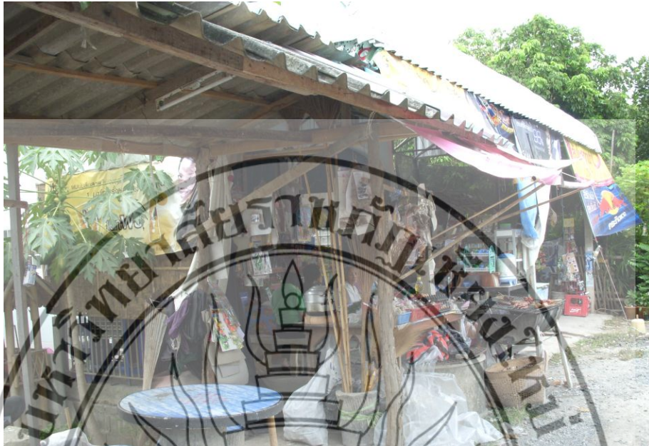
ภาพที่ 4.6 การประกอบอาชีพของคนในท้องถิ่นตำบลตลาดใหญ่ และตำบลสำราญราษฎร์ อำเภอคลองสระเกศ จังหวัดเชิงใหม่

และในตำบลตลาดใหญ่ และตำบลอื่นๆ ยังมีการส่งเสริม และถ่ายทอดเทคโนโลยีสมัยใหม่ที่เกี่ยวข้องการเกษตร เพื่อการพัฒนาเกษตรกรให้มีความรู้ใหม่ๆ ในการทำเกษตรกรรมที่ไม่ต้องพึ่งสารเคมี โดยการเปิดศูนย์ถ่ายทอดเทคโนโลยีการเกษตรประจำตำบล ดังภาพที่ 4.7