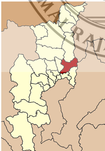
ภาพที่ 4.1 แผนที่อำเภอดอยสะเก็ดในจังหวัดเชียงใหม่ ที่มา: สารานุกรมวิกิพีเดีย, 2551

อำเภอดอยสะเก็ด จัดว่าเป็นอำเภอหนึ่งที่มีประวัติอันเก่าแก่ในด้านภูมิประเทศพุทธประวัติ และตำนานความเชื่อมากมายของคนโบราณ อำเภอดอยสะเก็ด เป็นชื่อเรียกตามลักษณะภูมิประเทศ ตามการมองเห็น เพราะเป็นภูมิประเทศที่มีภูเขาน้อยใหญ่มากมายอยู่เรียงกัน แต่มีภูเขาอยู่ลูกหนึ่งที่ตั้งแยกห่างออกไปจากภูเขาลูกอื่นๆ จึงเรียกว่าดอยสะเก็ด ตามภาษาพื้นเมืองภาคเหนือ แปลได้ว่าภูเขากระเด็น ต่อมาได้สร้างวัดขึ้นบนดอยสะเก็ด บ้างก็เรียกว่า ดอยเส้นเกศ เป็นสถานที่เก็บพระเกศของสมเด็จพระสัมมาสัมพุทธเจ้า ตามตำนานที่ว่าพญานาคได้สร้างเจดีย์ประดิษฐานเส้นพระเกศาไว้บนภูเขาลูกนี้ เรียกภูเขาลูกนี้ว่า “ดอยเส้นเกศ” ปัจจุบันยังคงมีวัดตั้งอยู่มีที่ว่าการอำเภอดอยสะเก็ด ตั้งอยู่บริเวณเชิงภูเขา ส่วนคำว่าดอยสะเก็ดเป็นคำที่เพี้ยนมาจาก ดอยสะเก็ด นั่นเอง