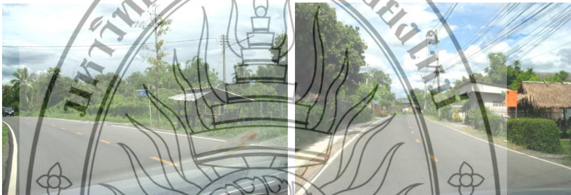
ภาพที่ 4.3 เส้นทางไปองค์การบริหารส่วนตำบลตลาดใหญ่

และจำนวนหลังคาเรือน 1,349 หลังคาเรือน ข้อมูลอาชีพของตำบล อาชีพหลักทำนา ทำสวน ทำไร่ ปลูกพืชอายุสั้น กระเทียม หอมแดง เลี้ยงสัตว์ รับจ้าง อาชีพเสริม คือ การแกะสลัก ตัดเย็บเสื้อผ้า ทำแชมพู ข้างซ่อมมือ และทำน้ำพริกตา ข้อมูลสถานที่สำคัญของตำบล ได้แก่ อบต. ตลาดใหญ่ สถานีอนามัยตำบลตลาดใหญ่ วัดศรีขยาราม (แม่ก๊ะเหนือ) และ วัดสุนทรศิริ (แม่ก๊ะใต้) โรงเรียน บ้านแม่ก๊ะตลาด โรงเรียนบ้านแม่จ้อง วัดพรหมจริยาราม (แม่ก๊ะตลาด) วัดมหาวนากิมุข (แม่จ้อง) วัดศรีดอนคู และ โรงเรียนอนุบาลสุมาลี