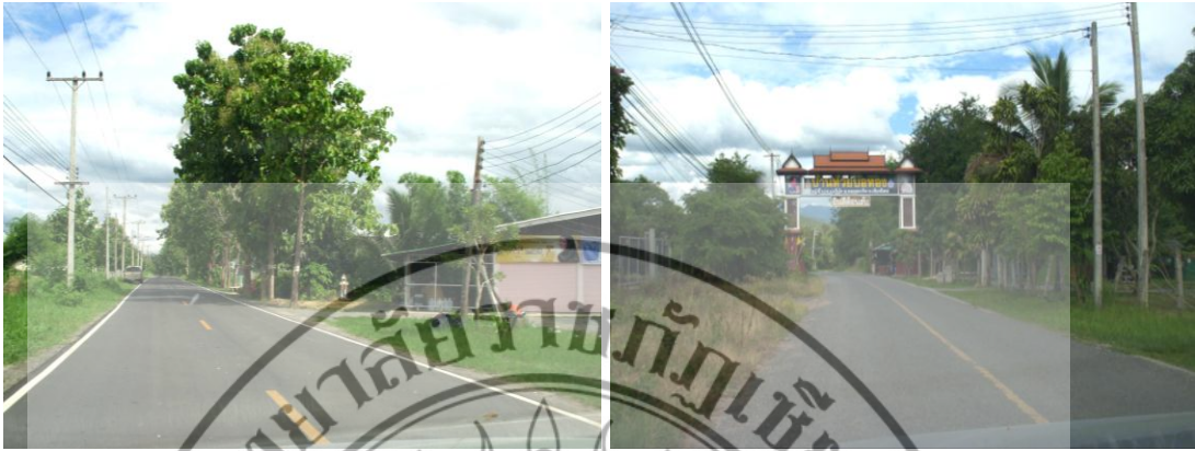
ภาพที่ 4.4 สภาพการคมนาคมระหว่างตำบล ในอำเภอคอยสะเกิด จังหวัดเชียงใหม่ ที่มา: อัญชดี โสมคี, 2551.