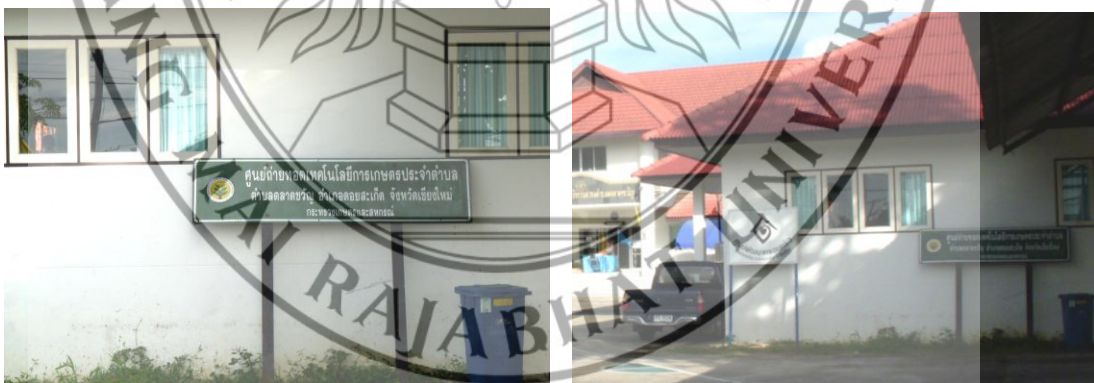
ภาพที่ 4.7 ศูนย์ถ่ายทอดเทคโนโลยีการเกษตรประจำตำบล อำเภอคลองสระเกศ จังหวัดเชิงใหม่

และในตำบลตลาดใหญ่ และตำบลอื่นๆ ยังมีการส่งเสริม และถ่ายทอดเทคโนโลยีสมัยใหม่ที่เกี่ยวข้องการเกษตร เพื่อการพัฒนาเกษตรกรให้มีความรู้ใหม่ๆ ในการทำเกษตรกรรมที่ไม่ต้องพึ่งสารเคมี โดยการเปิดศูนย์ถ่ายทอดเทคโนโลยีการเกษตรประจำตำบล ดังภาพที่ 4.7