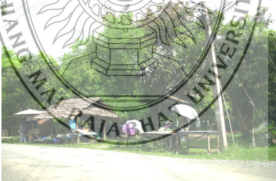
ภาพที่ 4.5 การประกอบอาชีพของคนในท้องถิ่นตำบลตลาดใหญ่ และตำบลราษฎร์ราษฎร์ อำเภอคอยสะเก็ด จังหวัดเชียงใหม่

เนื่องจากพื้นที่ของตำบลเชิงคอย ตำบลตลาดใหญ่ อำเภอคอยสะเก็ด เป็นภูเขาที่มีป่าไม้สมบูรณ์ บางส่วนเป็นที่ราบลุ่มสลับกันกับภูเขา มีคลองชลประทานที่ใช้ทำการเกษตรมากมาย ไม่ว่าจะมาจากเขื่อนแม่กวงไหลผ่านในตำบล หรือจากแหล่งธรรมชาติที่สำคัญได้แก่ น้ำแม่กวง แม่น้ำดอกแดง น้ำแม่โป่ง น้ำแม่ฮ้องฮัก และหนองบัวพระเจ้าหลวง ส่วนที่เป็นที่ราบลุ่มซึ่งเหมาะแก่การประกอบอาชีพเพาะปลูก ทำให้ประชากรอำเภอคอยสะเก็ดมีอาชีพหลัก คือ การทำการเกษตร ได้แก่ ทำนา ทำสวน เป็นหลัก ผลผลิตทางการเกษตรที่สำคัญ คือ ข้าว กระเทียม ปลาโคเนื้อ โคนม ไก่เนื้อ และไก่ไข่ออชิพรอง ได้แก่ออชิพรับจ้างทั่วไป และการแปรรูปผลผลิตทางการเกษตร เช่น การผลิตน้ำพริกเผา กุนเชียง แคมหมู กุ้งตาก สมุนไพรชง ชาชง แชมพู และน้ำยาล้างจาน งานหัตถกรรม คือ การผลิตโคมไฟ ผลิตภัณฑ์ป้ายชื่อ กรอบรูป แผ่นภาพติดผนัง ผลิตภัณฑ์ผ้าชิ้นทอมือ ถูข้อมือ ผ้าคลุมไหล่และกระเป๋าผ้าฝ้าย รายได้เฉลี่ยของประชากรในตำบล 19,650 บาท ต่อคนต่อปี ถือเป็นรายได้ที่ยังไม่ดีพอสำหรับเกษตรกรเนื่องจากกลไกการตลาดบางปีก็มีผลผลิตมาก ทำให้ราคาผลผลิตตกต่ำ ขาดการนำเทคโนโลยีมาใช้ในการเกษตรกรรม ผู้บริโภคตื่นกลัวเนื่องจากเกษตรกรใช้สารเคมีในการเกษตรกรรมมากเกินไป เป็นต้น สภาพการประกอบอาชีพนอกเหนือทำการเกษตรของคนในท้องถิ่นตำบลตลาดใหญ่ และตำบาราษฎร์ราษฎร์ ดังภาพที่ 4.5 และภาพที่ 4.6