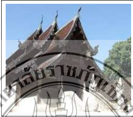
ภาพที่ 4.3 วัดดั้นเกว้น (วัดอินทราวาส)