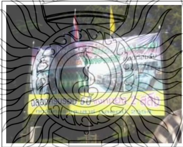
ภาพที่ 4.4 เชียงใหม่ไนท์ซาฟารี