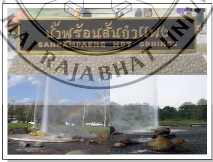
ภาพที่ 4.2 น้ำพุร้อนสันกำแพง