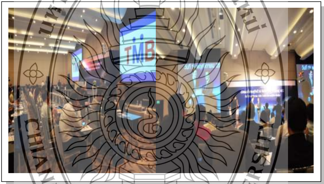
ภาพที่ 3.8 ภาพบรรยากาศการสัมมนา เรื่อง เปิดแผนที่เศรษฐกิจปี 54

5.5.2 วิธีการดำเนินกิจกรรม คือ จะเป็นในรูปแบบของการบรรยาย การซัก-ถาม และการยกตัวอย่างผู้ประกอบการที่ประสบผลสำเร็จ ระยะเวลาของการดำเนินกิจกรรมครั้งนี้คือ วันที่ 19 พฤศจิกายน 2553 เวลา 12.30 – 17.00 น. ณ โรงแรม เลอ เมอริเดียน เชียงใหม่ (บรรยายภาคในวันงานดังภาพที่ 3.8)