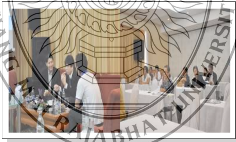
ภาพที่ 3.3 ภาพบรรยากาศการสัมมนาเรื่อง SMEs ไทยเข้มแข็งด้วย ICT และผู้ประกอบการสาขาต่าง ๆ ที่เป็นกลุ่มตัวอย่างในงานวิจัย

ผู้ประกอบการงานค้าทอที่เป็นกลุ่มตัวอย่างในงานวิจัยสามารถเข้ารับฟังสัมมนาในหัวข้อตามที่สนใจได้ และสามารถนำความรู้ไปต่อยอดธุรกิจของตนเองได้ อีกทั้งสามารถสมัครเป็นสมาชิกของศูนย์ส่งเสริมการใช้ระบบ ICT สำหรับวิสาหกิจ โดย SIPA เพื่อได้รับความช่วยเหลือในด้านต่าง ๆ จากศูนย์ฯลฯ ได้อีกด้วย (ภาพบรรยากาศในการจัดงาน ดังภาพที่ 3.3)