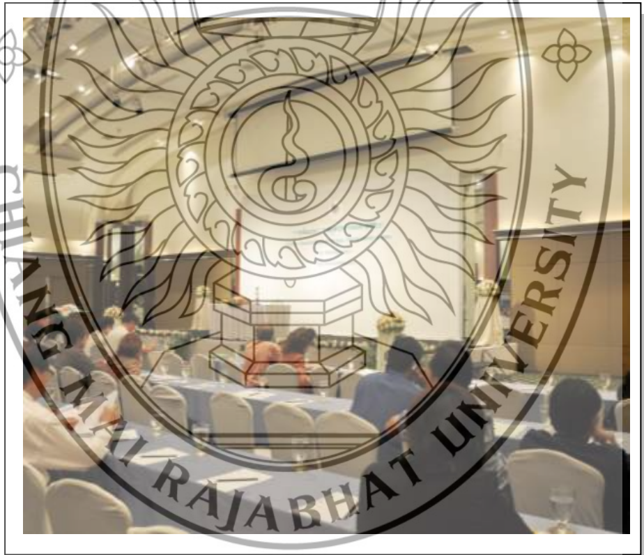
ภาพที่ 3.4 ภาพบรรยากาศในการสัมมนา “กลยุทธ์ทางรอด SMEs”

การบรรยายเพื่อให้ความรู้ของวิทยากรผู้เชี่ยวชาญด้านกลยุทธ์การตลาด ผู้ประกอบการที่ประสบความสำเร็จ และการเปิดคลินิกให้คำแนะนำแก่กลุ่มผู้ประกอบการสาขาต่าง ๆ รวมถึงผู้ประกอบการงานผ้าทอที่เป็นกลุ่มตัวอย่างในงานวิจัย นับว่าเป็นประโยชน์อย่างมาก ทั้งยังนำเอาความรู้จากการบรรยายมาประยุกต์ใช้ในการดำเนินธุรกิจให้แก่กลุ่มต่าง ๆ ได้เป็นอย่างดี (ภาพบรรยากาศวันงาน ดังภาพที่ 3.4 และภาพที่ 3.5)