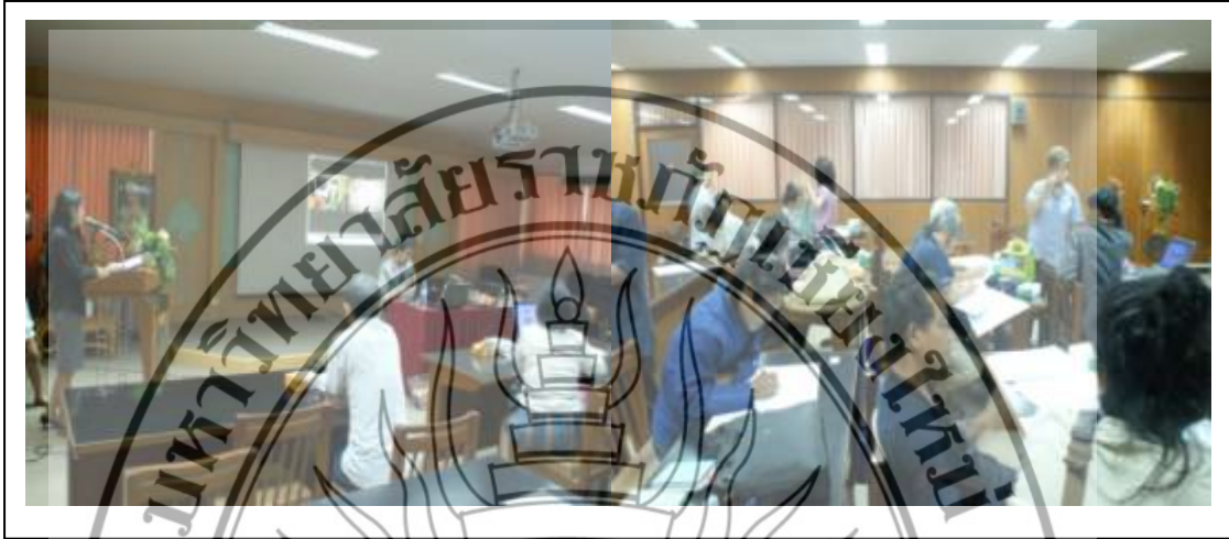
ภาพที่ 3.13 ภาพบรรยายภาคของการให้ความรู้และการฝึกปฏิบัติการ ทางการออกแบบตราสินค้าและการออกแบบบรรจุภัณฑ์

เอกลักษณ์เป็นของตนเองมากยิ่งขึ้น และเป็นที่รู้จักจดจำของลูกค้ามากขึ้น (บรรยายภาคในการจัดงาน ดังภาพที่ 3.13)