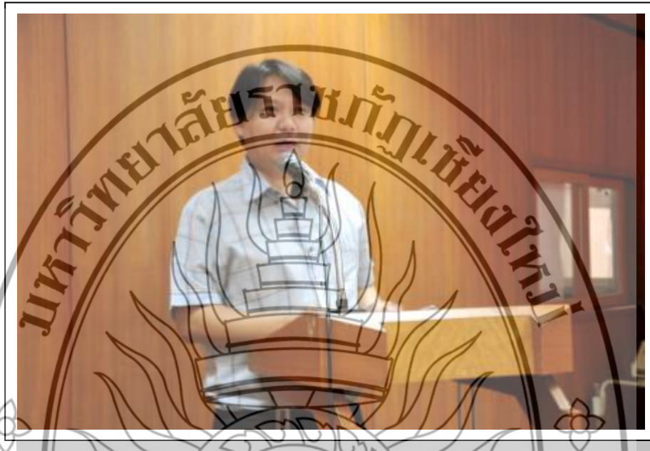
ภาพที่ 3.2 ภาพบรรยากาศการจัดเวทีการเรียนรู้ครั้งที่ 1 โดยมีผู้วิจัยเป็นพิธีกรในดำเนินงาน

การสร้างรายได้ให้แก่ตนเองและสร้างงานให้แก่คนในท้องถิ่นอีกด้วย (ภาพบรรยากาศภายในงาน ดังภาพที่ 3.2)