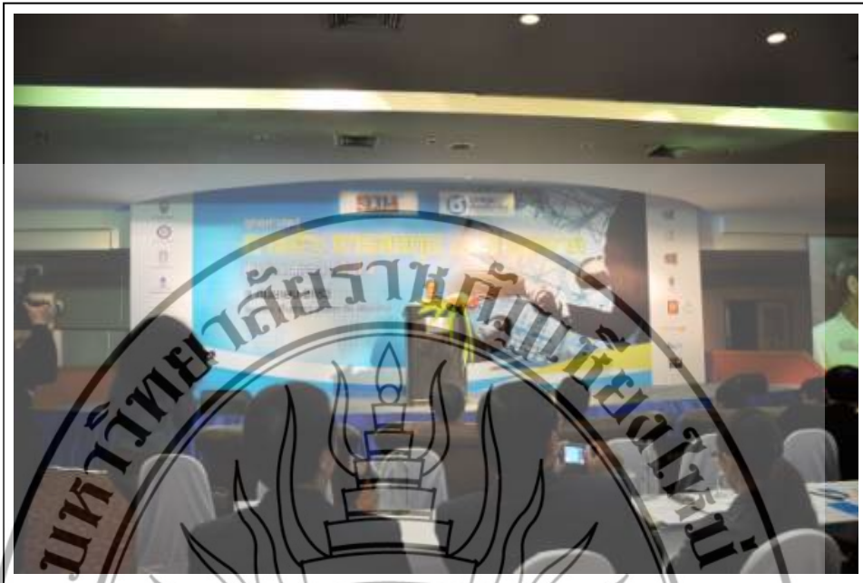
ภาพที่ 3.6 ภาพบรรยากาศการเปิดงานยุทธศาสตร์การค้า การลงทุน และการตลาด โดยมีแขกผู้มีเกียรติและกลุ่มผู้ประกอบการงานหัตถกรรมสาขาต่าง ๆ ในจังหวัดเชียงใหม่เข้าร่วมงาน