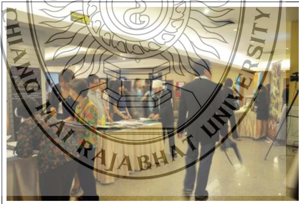
ภาพที่ 3.7 ภาพบรรยากาศภายนอกห้องประชุม จะมีหน่วยงานของภาครัฐบาล และเอกชน นำข้อมูลที่สำคัญต่อการดำเนินธุรกิจมาเผยแพร่