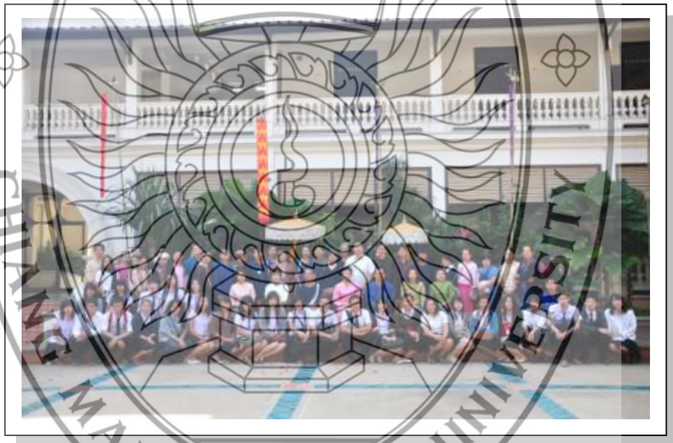
ภาพที่ 3.9 ภาพบรรยากาศนิทรรศการ “มองภูมิปัญญาล้านนาผ่านสายธารแห่งกาลเวลา” โดยมีรองผู้ว่าราชการจังหวัดเชียงใหม่ เป็นประธานในพิธีเปิด รวมไปถึงท่านวัฒนธรรมจังหวัดเชียงใหม่ และอธิการบดีมหาวิทยาลัยราชภัฏเชียงใหม่ ให้เกียรติเข้าร่วมพิธี

5.6.2 วิธีการดำเนินกิจกรรม ได้แก่ การจัดนิทรรศการให้ความรู้ บรรยาย การสาธิตการทำงานหัตถกรรมสาขาต่าง ๆ และการซัก-ถาม ให้ความรู้จากผู้เชี่ยวชาญ ระยะเวลาในการดำเนินกิจกรรมครั้งนี้คือ ตั้งแต่วันที่ 9 ธันวาคม 2553 – 9 มกราคม 2554 ณ หอศิลป์วัฒนธรรมเมืองเชียงใหม่ ดังภาพบรรยากาศการจัดนิทรรศการ ภาพที่ 3.9