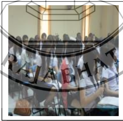
ภาพที่ 3.16 ภาพบรรยากาศการสัมมนาเรื่อง “แนวทางการคัดสรรสุดยอดหนึ่งตำบล หนึ่งผลิตภัณฑ์ไทย” ณ ห้องถ้ำนาฬิกา อาคารเทพรัตนราชสุดา