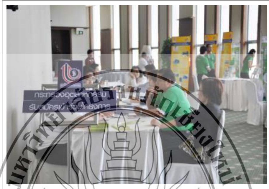
ภาพที่ 3.5 ภาพบรรยากาศการสัมมนา ในภาคบ่ายเป็นการเปิดคลินิกให้บริการ และให้คำปรึกษาด้านต่าง ๆ แก่กลุ่มผู้ประกอบการ