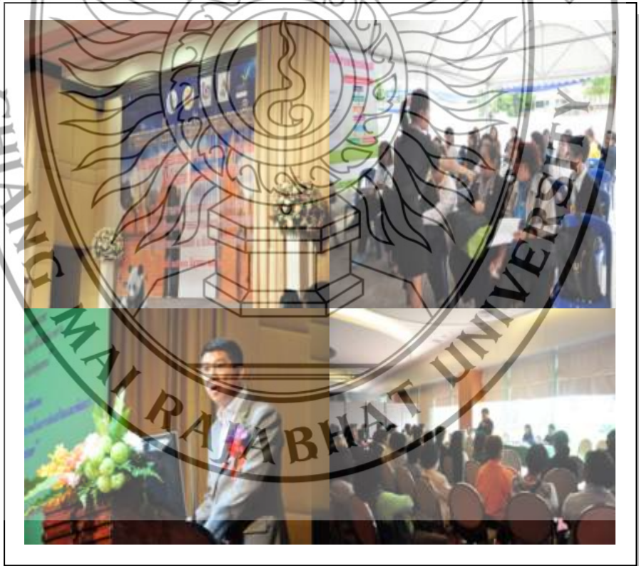
ภาพที่ 3.12 ภาพบรรยากาศการสัมมนาเชิงปฏิบัติการ

5.9.2 วิธีการดำเนินกิจกรรม ได้แก่ การบรรยาย และสาธิตวิธีการทำงานหัตถกรรม เพื่อให้ได้มาตรฐานผลิตภัณฑ์ชุมชน ระยะเวลาในการดำเนินกิจกรรม ระหว่างวันที่ 25 -26 มีนาคม 2554 เวลา 09.00 – 16.00 น. ณ ห้องประชุมดิเอ็มเพลสแกรนด์ฮอลล์ ชั้น 3 โรงแรม ดิเอ็มเพลส เชียงใหม่ จังหวัดเชียงใหม่ (บรรยากาศในการจัดงาน ดังภาพที่ 3.12)