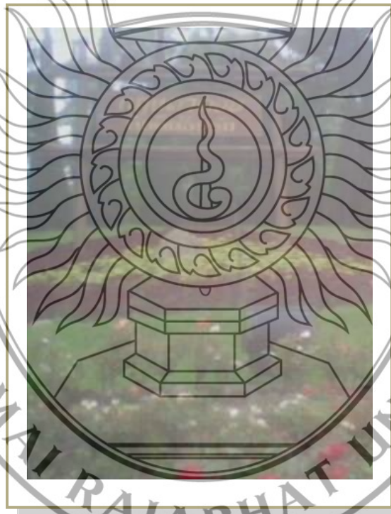
ภาพที่ 4.7 กฤษฎาดอย รีสอร์ท