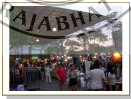
ภาพที่ 4.4 ภาพบรรยากาศการจับจ่ายซื้อของภายในตลาดมิโซค