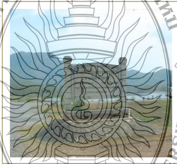
ภาพที่ 4.6 อ่างเก็บน้ำห้วยลาน