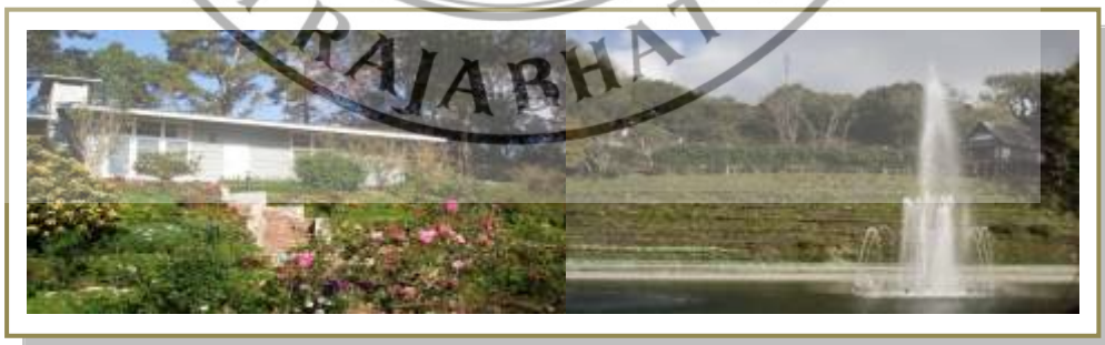
ภาพที่ 4.5 พระตำหนักภูพิงค์ราชินีเวศน์