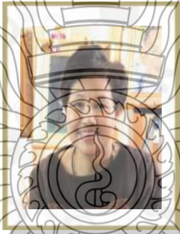
ภาพที่ 2.6 ม.ร.ว. คัจฉาพิมล ดุรงคานุก

จากบทความข้างต้น จะเห็นได้ว่า ในการดำเนินชีวิตแบบเศรษฐกิจพอเพียง แบบ ม.ร.ว. คัจฉาพิมล ดุรงคานุก ดังภาพที่ 2.6 คือ การใช้ชีวิตอย่างธรรมดา เรียบง่ายไม่ฟุ่มเฟือย ซึ่งมีความสอดคล้องกับแนวคิดเศรษฐกิจพอเพียง คือ ความพอประมาณ และมีเหตุผล