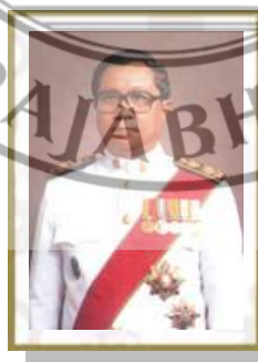
ภาพที่ 2.9 ศ. ดร. เอกวิทย์ ณ ถลาง