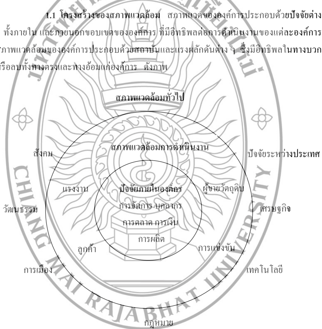
ภาพที่ 2.2 โครงสร้างสภาพแวดล้อมของธุรกิจ

1.1 โครงสร้างของสภาพแวดล้อม สภาพแวดล้อมขององค์กรประกอบด้วยปัจจัยต่าง ๆ ทั้งภายใน และภายนอกขอบเขตขององค์กร ที่มีอิทธิพลต่อการดำเนินงานของแต่ละองค์กร สภาพแวดล้อมขององค์กรประกอบด้วยสถาบันและแรงผลักดันต่าง ๆ ซึ่งมีอิทธิพลในทางบวกหรือลบทั้งทางตรงและทางอ้อมแก่องค์กร ดังภาพ