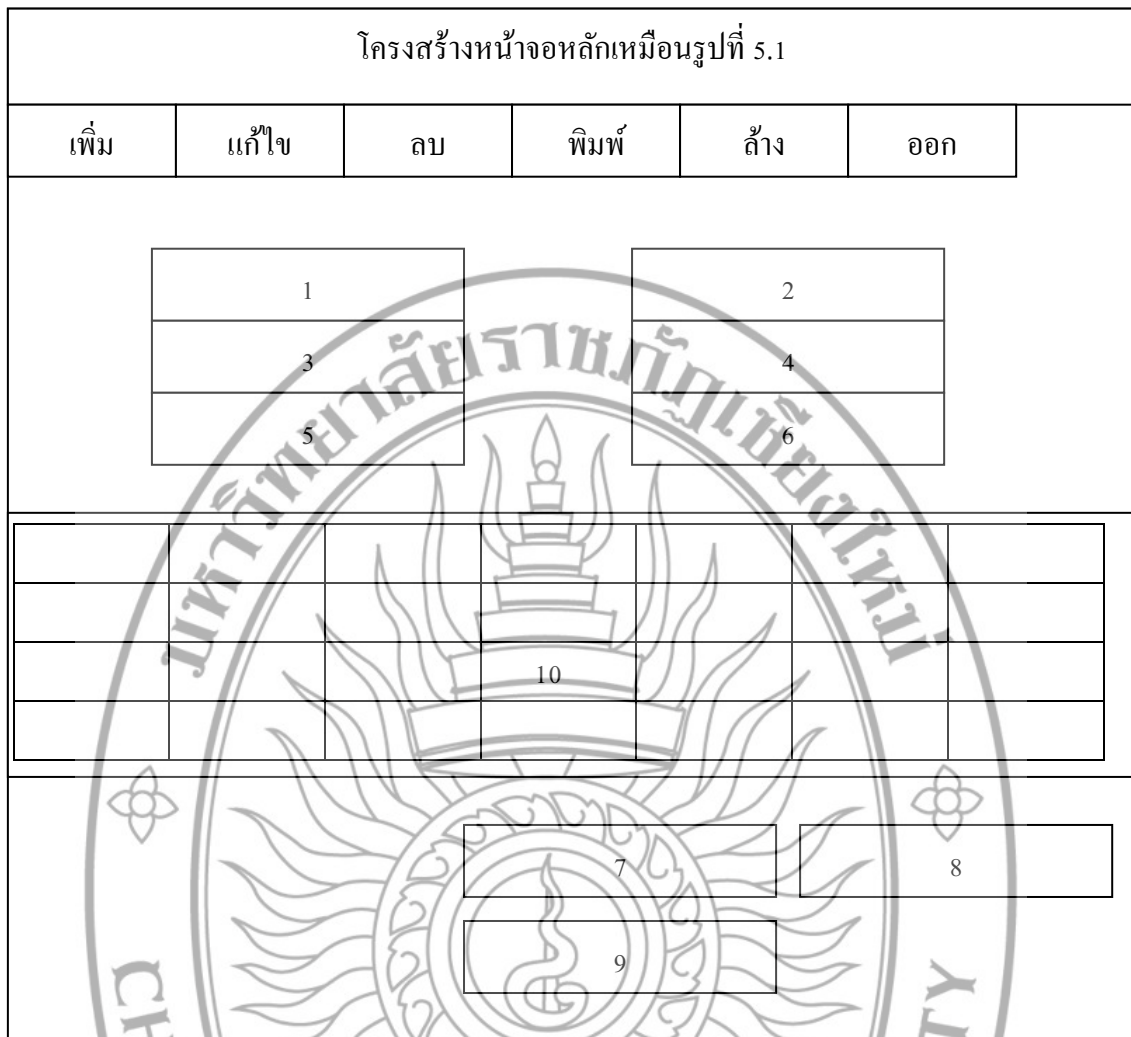
รูปที่ 5.12 การออกแบบบันทึกการปันผลสำเร็จ