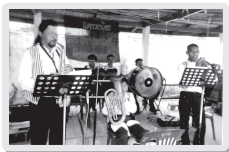
บรรเลงงานศพ (งานอวมงคล)

แถววงคณะน้อยมีบทบาทในการให้ความบันเทิงและรับใช้พิธีกรรมต่างๆ ในชุมชน การบรรเลงเพลงจะใช้เพลงที่มีเอกลักษณ์เฉพาะตัว และสามารถสร้างทำนองเพลงอย่างหลากหลาย โดยใช้ระบบเสียงตะวันตกที่มี 12 เสียงห่างเท่าๆ กันใน 1 ช่วงทาบ (Twelve temperament) เครื่องดนตรีที่ใช้ในการบรรเลงส่วนใหญ่เป็นเครื่องดนตรีส่วนตัวของสมาชิกภายในวง ได้แก่ ทรัมเป็ต (Trumpet), ทรอมโบน (Trombone), อัลโตแซกโซโฟน (Alto Saxophone), เทนเนอร์แซกโซโฟน (Tenor Saxophone), กลองทิมทอม (Tim Tom), กลองใหญ่ (Bass Drum), และฉาบ (Cymbal) บทบาทและหน้าที่ของแถววงคณะน้อย ในสังคมตำบลต้นธงชัยพบว่าไม่เป็นที่นิยม พอสรุปได้ว่า แถววงคณะน้อยก็ยังมีบทบาทในพิธีกรรมเช่นเดียวกับดนตรีไทย เช่น ใช้ในพิธีแห่หน้าค แห่ขันหมาก และพิธีศพ ซึ่งเป็นบทบาทที่ให้ความสนุกสนานครื้นเครง