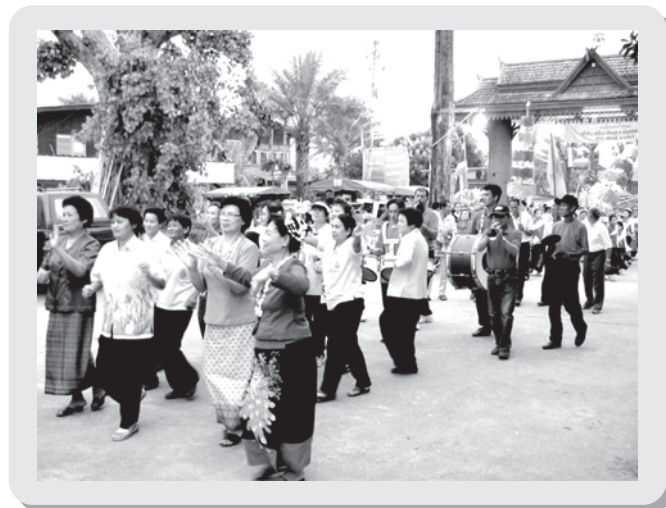
แถววงคณะน้อยบรรเลงแห่งานยกช่อฟ้า วัดวังหม้อ ตำบลต้นธงชัย อำเภอเมือง จังหวัดลำปาง (งานมงคล)

มี 2 ลักษณะ คือ บทเพลงที่ใช้ในงานมงคล ได้แก่ เพลงไทยเดิมที่มีท่วงทำนองรื่นเรริงสนุกสนาน และเพลงลูกทุ่งตามสมัยนิยม บทเพลงที่ใช้ในงานอวมงคลจะมีเพลงไทยเดิมที่เล่นประจำ คือ เขมรโพธิสัตว์และเพลงสากลเก่าๆ ซ้ำๆ แล้วแต่ผู้ว่าจ้าง