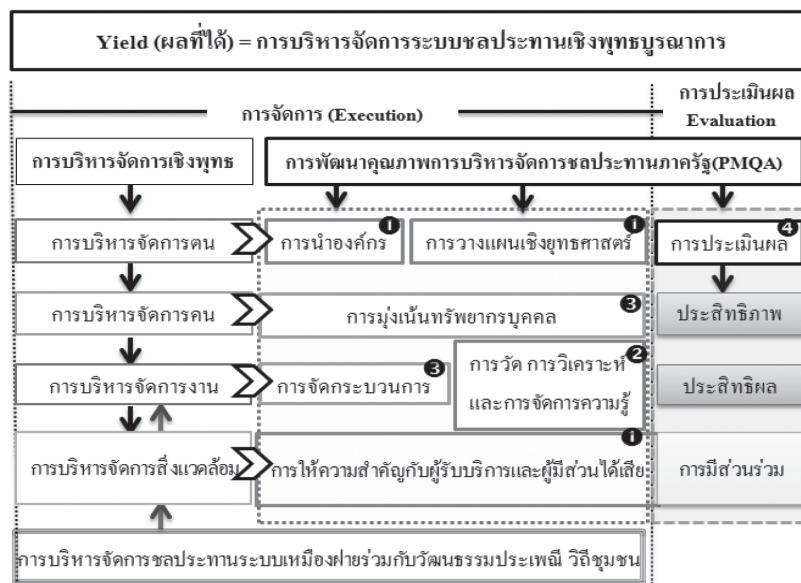
ภาพที่ 1 ความสัมพันธ์การบริหารจัดการระบบชลประทานเชิงพุทธบูรณาการ แบบหยีโมเดล

ผู้วิจัยจึงได้นำการบริหารจัดการเชิงพุทธมาผสมผสานในกระบวนการทำงานและอาศัยกระบวนการความรู้ (Knowledge: K) และทัศนคติ (Attitude: A) ของกลุ่มตัวอย่างต่างๆ เพื่อนำไปสู่การปฏิบัติงาน (Practice: P) ของบุคคลทั้ง 3 กลุ่ม คือ กลุ่มการนำองค์กร กลุ่มปฏิบัติการ และกลุ่มพื้นฐานของระบบ ซึ่งรวมถึงผู้รับบริการและผู้มีส่วนได้ส่วนเสีย ก็คือ ผู้ใช้น้ำด้วย ซึ่งการบริหารจัดการระบบชลประทานเชิงพุทธบูรณาการ รูปแบบหยีโมเดล (YEE Model) (Y: Yield, E: Execution, E: Evaluation) ทำให้เกิดการเปลี่ยนแปลงขององค์กรในทิศทางที่ดีขึ้น โดยดูจากการประเมินผลในด้านประสิทธิภาพการชลประทาน ประสิทธิภาพด้านรายได้ ผลผลิตการเกษตร และความพึงพอใจในการมีส่วนร่วมของผู้ใช้น้ำ ดังที่แสดงในภาพที่ 1 และภาพที่ 2 ตามลำดับ ดังนี้