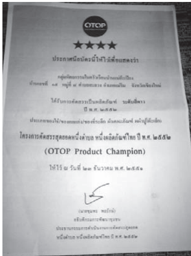
ภาพที่ 1 แสดงใบประกาศนียบัตร OTOP ระดับ 4 ดาว

ผลิตภัณฑ์ที่จัดจำหน่าย แบ่งเป็นหมวดหมู่ดังนี้ ผ้าพันคอ กระเป๋า เสื้อผู้หญิง ผ้าถุง ผ้าคลุมเตียง ผ้าปูโต๊ะเล็ก