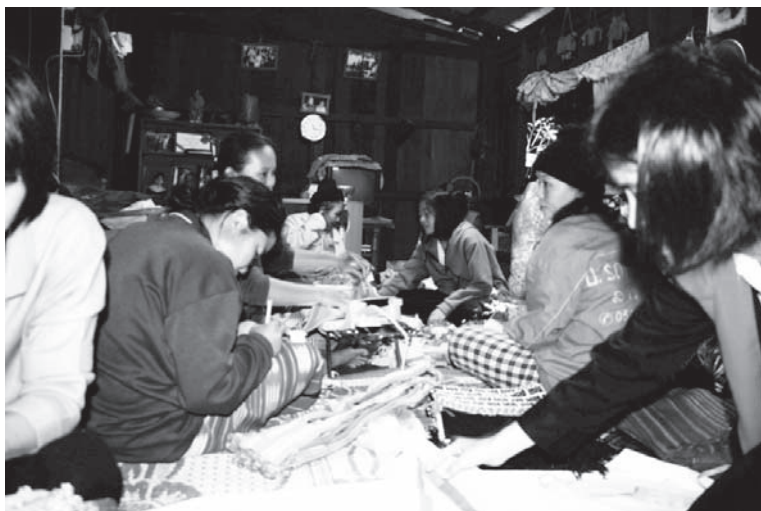
ภาพที่ 3 แสดงกิจกรรมการเตรียมผลิตภัณฑ์ผ้าทอกระเบื้องไปจำหน่าย