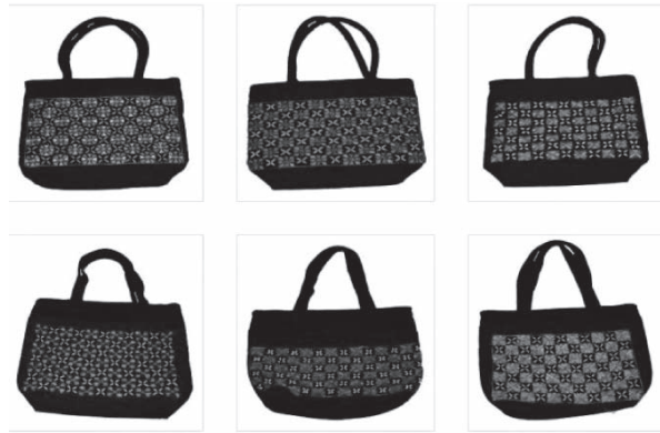
ภาพที่ 2 ตัวอย่างผลิตภัณฑ์ผ้าทอกระเบื้อง